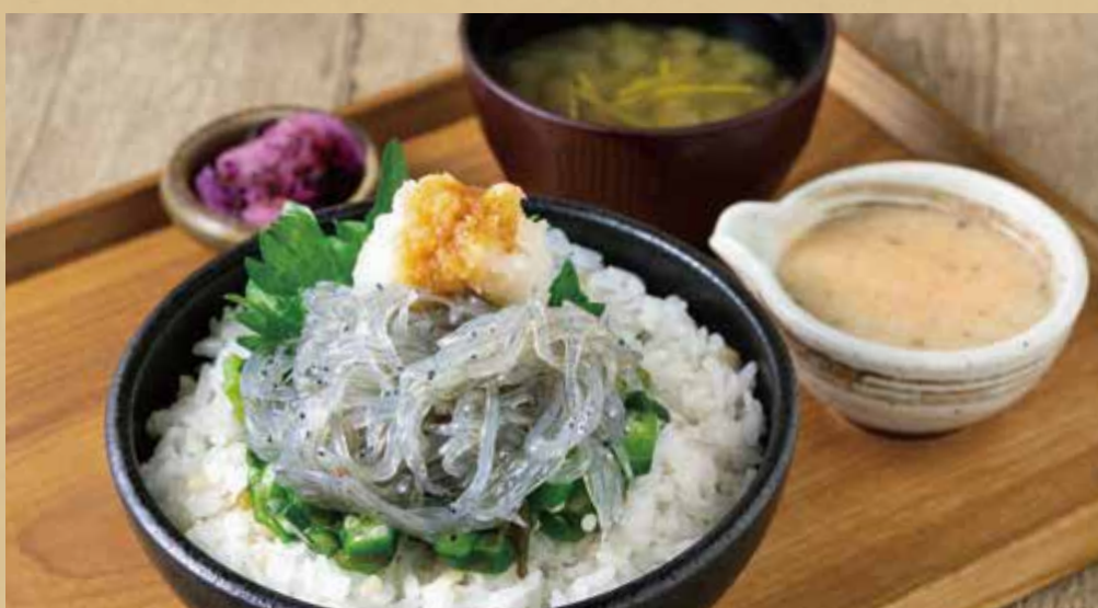
生しらすのネバトロ自然薯とろろ丼定食

Set Meal with Jinenjo Tororo Over Rice - Fresh (Uncooked) Whitebait with Gooey Vegetables -