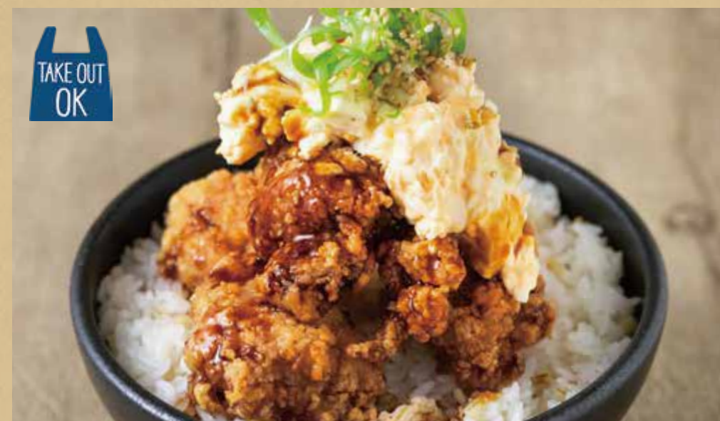
旨味唐揚げ チキン南蛮風丼

Deep-Fried Chicken Rice Bowl - Chicken Nanban Style -