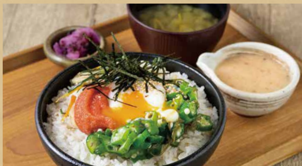
明太子と半熟たまご、オクラの自然薯とろろ丼定食

Set Meal with Jinenjo Tororo Over Rice - Spicy Cod Roe, Poached Egg, and Okra -