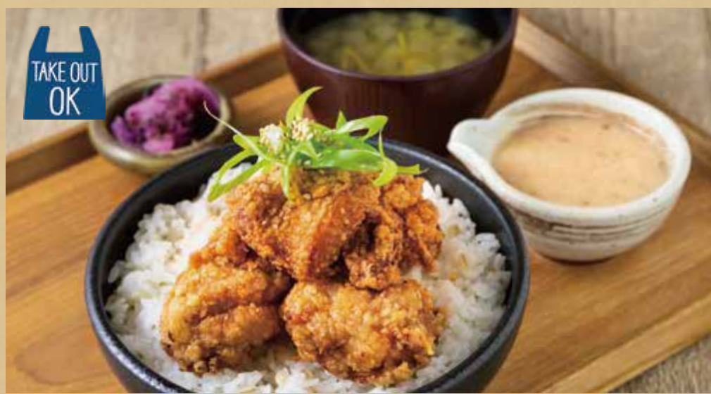
旨味唐揚げ自然薯とろろ丼定食

Set Meal with Jinenjo Tororo Over Rice - Savory Deep-Fried Chicken -