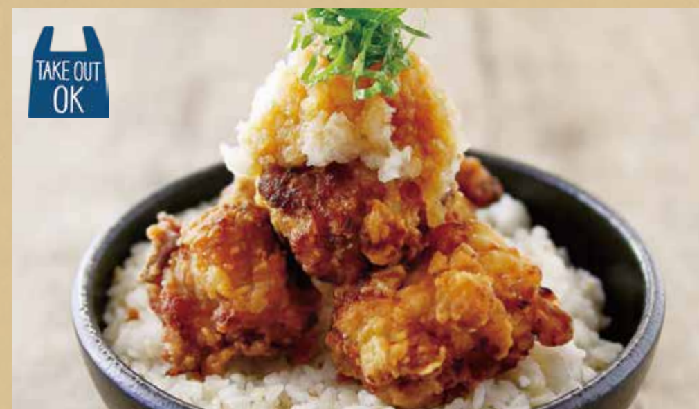
旨味唐揚げ おろしそ丼

Deep-Fried Chicken Rice Bowl - Topped with Grated Radish and Shiso -