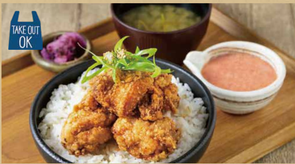
旨味唐揚げ明太子自然薯とろろ丼定食

Set Meal with Jinenjo Tororo Over Rice - Savory Deep-Fried Chicken and Tororo with Spicy Cod Roe -