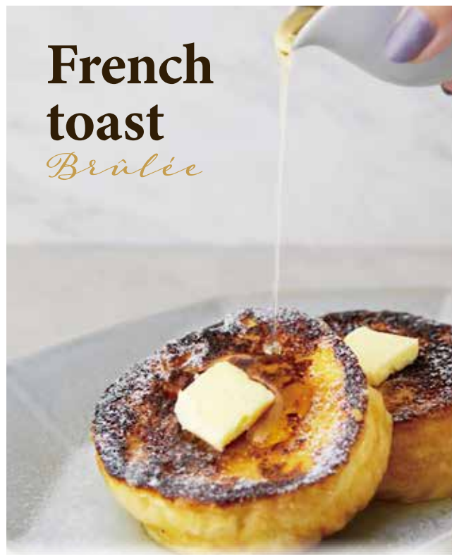
Brûlée french toast with Rokko honey & butter 六甲はちみつ&発酵バターの ブリュレフレンチトースト