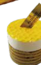
Au miel citron 神戸はちみつのシトロンレア 単品 ¥616