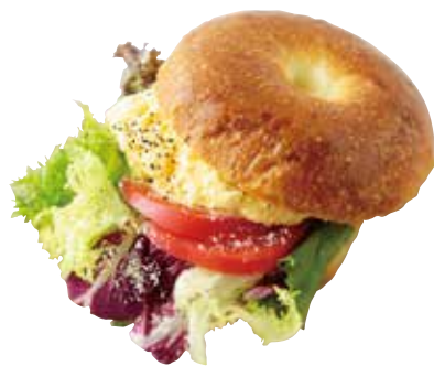
Bagel sandwich -egg tartar- タルタルたまごのベーグルサンド