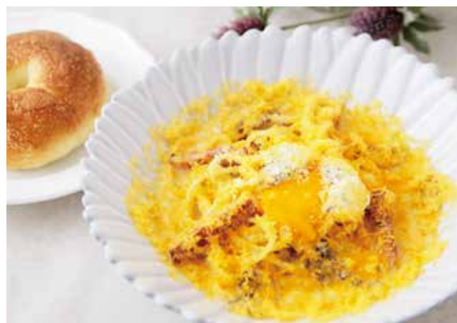
Carbonara pasta with salad TOOTH TOOTH カルボナーラ (ベーグル付き) ¥1650 サラダセット +¥200