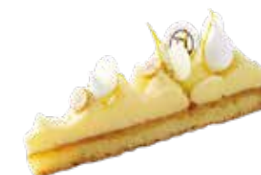
Tarte au Citron 瀬戸内レモンのタルト 単品 ¥616

下記より好きなケーキ + コーヒー／紅茶／ジュース (オレンジ・アップル・マンゴー)