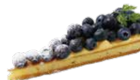
Tarte aux myrtilles タルトブルーベリー 単品 ¥638