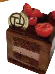
Ruby cube chocolat ルビーキューブショコラ 単品 ¥616