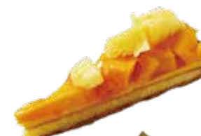
Tarte aux tropique タルトトロピック 単品 ¥638