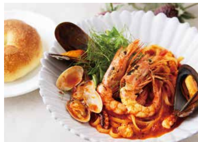
Pescatora pasta with salad SEASIDE ペスカトーレ (ベーグル付き) ¥1800 サラダセット +¥200