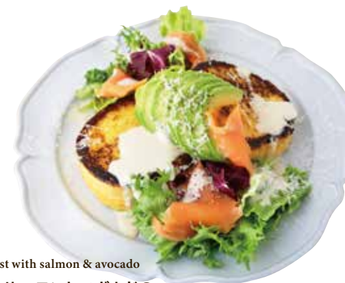
French toast with salmon & avocado スモークサーモンとアボカドの フレンチトースト