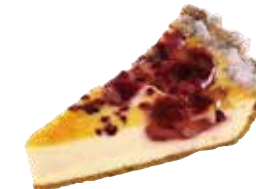
Chaperon fraise シャペロン 単品 ¥572