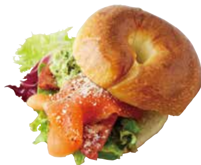
Bagel sandwich -salmon & avocado- サーモンアボカドのベーグルサンド