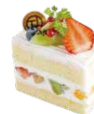
Biscuit aux Fruits ビスキュイ オ フリュイ 単品 ¥616