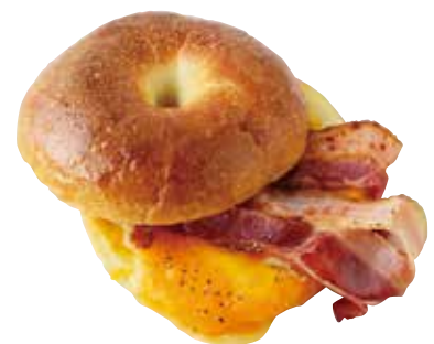
Bagel sandwich -bacon & cheese- ベーコンとチーズのホットベーグルサンド