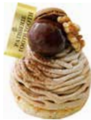
Mont Blanc モンブラン