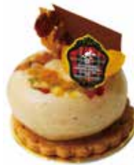
Montélimar 六甲はちみつのモンテリマール

甘くてなめらかな安納芋と 紅あずまのクリームと 煮詰めたりんごのコンポートの重ね合わせ