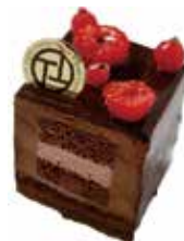
Ruby cube chocolat ルビーキューブショコラ