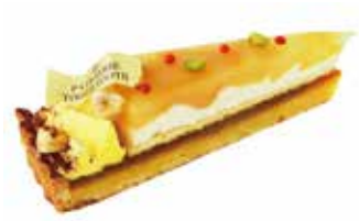
Tarte jaunir タルトジョニール