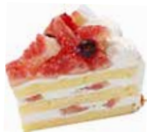
Gâteau Figue ガトーフィグ

ブリゼ生地のタルトベースに甘酸っぱい イチゴとミルクッシュな クリームをあわせたベイクドチーズケーキ