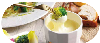
チーズフォンデュセット