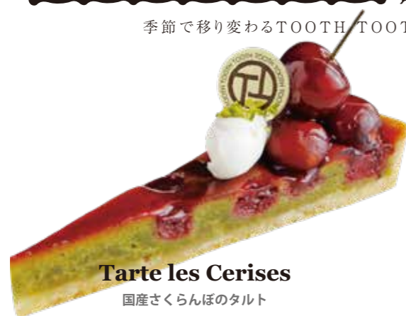
Tarte les Cerises