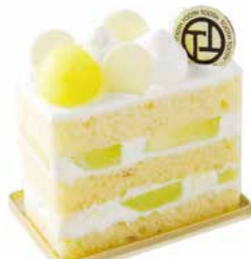
Gâteau Le Melon

白果皮に包まれた瑞々しい果実と香ばしく 焼き込んだアーモンドクリームをごいっしょに