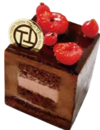
Ruby cube chocolat

ブリゼ生地のタルトベースに甘酸っぱい苺と ミルクッシュなクリームをあわせて焼き上げました