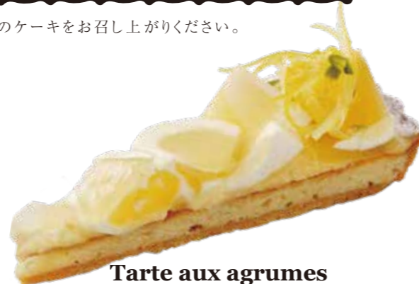
Tarte aux agrumes

大粒に実ったさくらんぼの濃厚な味わいと ピスタチオをきかせた アーモンドクリームのマリアージュ。