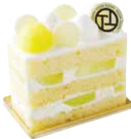
Gâteau le melon マスクメロンのショートケーキ

神戸・いなだ養蜂園のはちみつをきかせたレアチーズを 瀬戸内から届いたレモン果汁のクリームとご一緒に