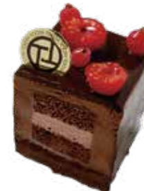
Ruby cube chocolat ルビーキューブショコラ

クリーミーなフランボワーズのバタークリームと アーモンド生地で作った上品な味わいのケーキ