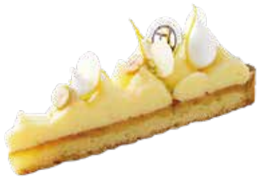
Tarte au citron 瀬戸内レモンのタルト