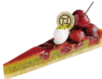
Tarte les cerises さくらんぼのタルト