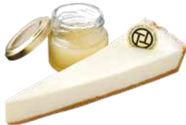
Melty rare fromage メルティレア

真っ赤に実ったさくらんぼと ピスタチオをきかせたアーモンドクリームのマリアージュ