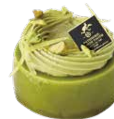
Pistache été ピスタチオエテ

“果物の王様”、香しいマスクメロンを しっとり生地となめらかなクリームとごいっしょに