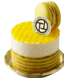
Au miel citron シトロンレア