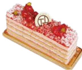
Gâteau franboise ガトーフランボワーズ