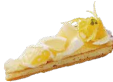
Tarte aux agrumes 柑橘のタルト

愛媛県 岩城島から届くレモンをまるごと搾って クリームのを引き立てた夏のスペシャルティ