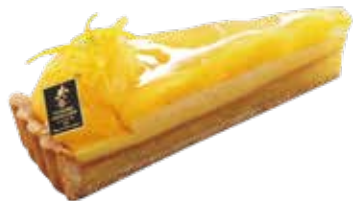
Tarte gelée de mandarine 夏みかんのジュレタルト

白果皮に包まれた瑞々しい果実と 香ばしく焼き込んだアーモンドクリームをごいっしょに