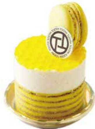
Au miel citron

スペイン産クーベルチュールの香りと ジェノワーズショコラの カカオコントラストをどうぞ