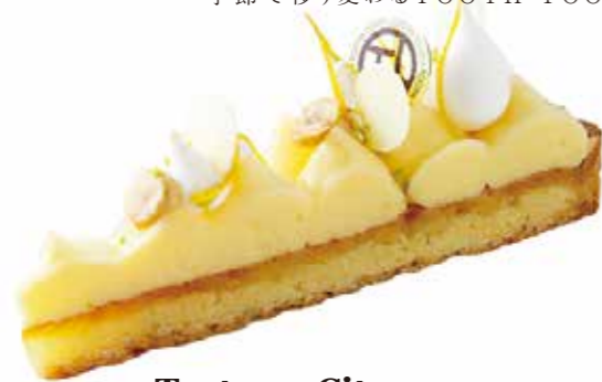
Tarte au Citron