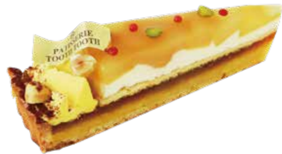
Tarte aux Pommes et Patate douces