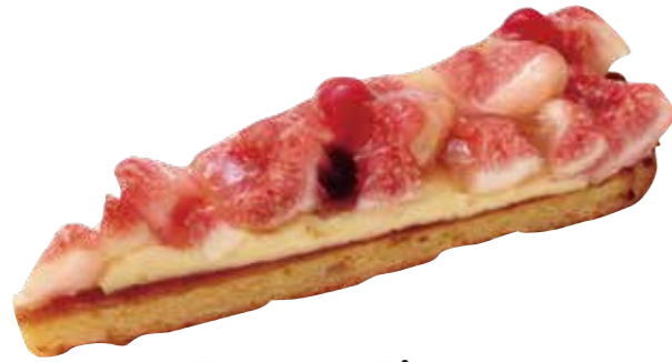
Tarte aux Figues