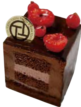
Ruby cube chocolat

甘くてなめらかな安納芋と紅あずまのクリームと 煮詰めたりんごのコンポートの重ね合わせ