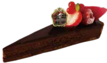
Tarte berry chocolat