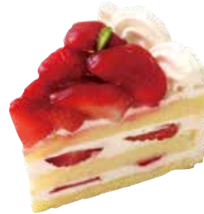
Gâteau aux fraise

フランボワーズガナッシュのフルーティな風味を ビスキュイショコラの香ばしさとごいっしょに