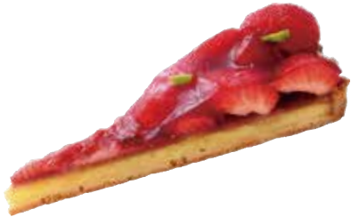
Tarte aux fraise