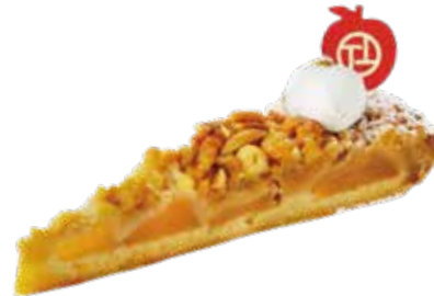
Tarte aux pommes

真っ赤に実った苺とタルト&アーモンドクリームが自慢 トゥーストゥースの王様タルト