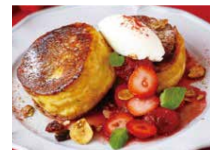
Strawberry French Toast 苺のフレンチトースト 1,500 (1,650)