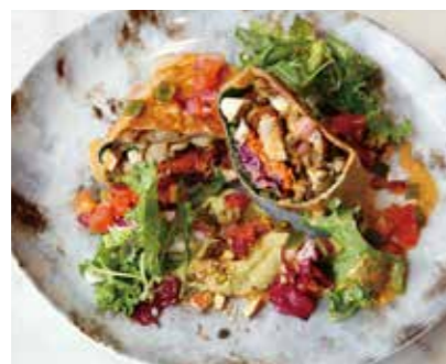
Spicy Chicken Burrito スパイシーチキンの ブリトー 1,380 (1,518)