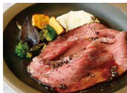
Wagyu roast beef 和牛のローストビーフ 2,800 (3,080)