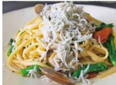
Red sea bream and broccoli in Genovese sauce with crunchy breadcrumbs 淡路産釜揚げシラスと菜の花 セミドライトマトのオイルソース 1,900 (2,090)