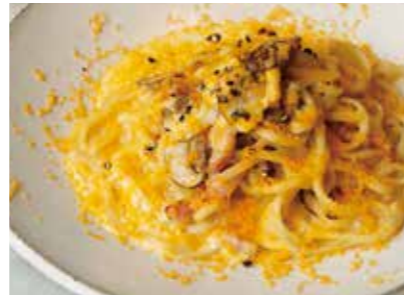
Rokko mushrooms and bacon TOOTHTOOTH carbonara 六甲マッシュルームとベーコンの TOOTHTOOTH カルボナーラ 2,100 (2,310)