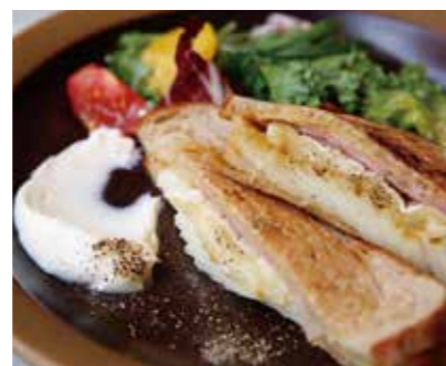
Apple And Bacon Hot Sandwich アップルとベーコンの ホットサンド 1,480 (1,628)