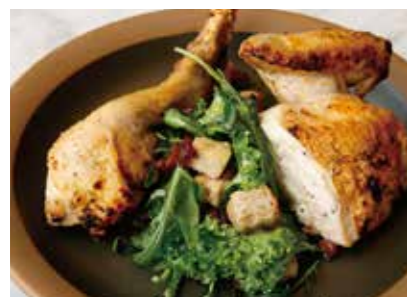
Kiln-roasted domestic chicken roisserie chicken 国産鶏の窯焼き ロティサリーチキン 2,200 (2,420)