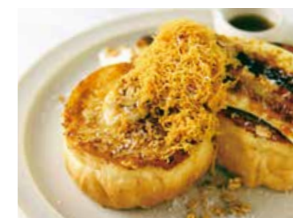
French Toast with Brown Cheese and Caramel Banana ブラウンチーズとキャラメルバナナの フレンチトースト 1,280 (1,408)