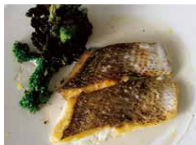
Today's fresh fish grilled in a stone oven with yuzu flavor beurre blanc sauce 本日鮮魚の石窯グリル 檸檬のヴァンプランソース 2,400 (2,640)