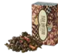
ブルリアンローズ ¥700 (税込¥770)

ケニアティーに粗挽きショウガを合わせました。 ミルクをたっぷり入れてコクのある まろやかなジンジャーティーを。