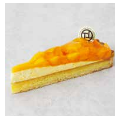
Tarte à la mangue マンゴータルト ¥850 (税込¥935)