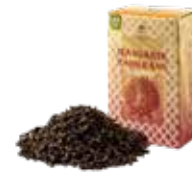
マンダリンオレンジ ¥700 (税込¥770)

ルイボスベースのアールグレイ。ほのかな甘さと ベルガモットのフレッシュさがマッチした一杯。 食事に合わせても◎