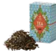
ダージリン ¥750 (税込¥825)

すっきりとした優雅な薫りとマイルドな口あたりは 「紅茶のブルーマウンテン」のよう。 ストレートはもちろん、ミルクとの相性も抜群です。