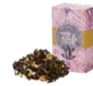
カモミールダージリン ¥700 (税込¥770)

「ブルガリアンローズ」から抽出したふんわり 甘い薫りと、優しく華やかな風味が エレガントなティータイムを演出します。