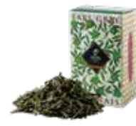
アールグレイジャポネ ¥700 (税込¥770)

グレイ伯爵へ敬意を込めた、トラディショナルな アールグレイ。キーンとベルガモットを着香した フレッシュでありながらボディ感のある味わい。