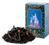
アールグレイの肖像 ¥750 (税込¥825)

すっきりとした薫りとほのかな甘みが心地よい オレンジフレーバーを、烏龍茶葉にあわせました。