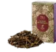
ゴーギャンの森 ¥750 (税込¥825)

スパイスの女王カルダモンをベースにした エキゾチックなブレンドティーです。 ミルクと合わせてお召し上がりください。