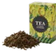
シトロンシュプリーム ¥650 (税込¥715)

セイロンティーに清涼感あふれる ベルガモット柑橘系の香りをつけました。 自然で落ち着きのある芳香をお楽しみください。