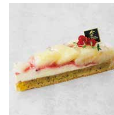
Tarte aux pêches 白桃のタルト ¥850 (税込¥935)