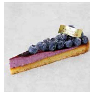
Tarte aux myrtilles ブルーベリーのタルト ¥800 (税込¥880)