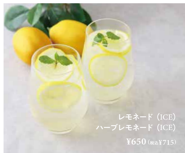
レモネード (ICE) ハーブレモネード (ICE) ¥650 (税込¥715)