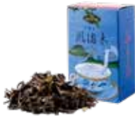
風海木 ¥750 (税込¥825)

茶葉が醸し出すほのかな甘みは フルーツとの相性ピッタリ。 さっぱりした香りとお口の中に広がります。