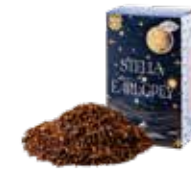
ステラバイアールグレイ ¥700 (税込¥770)

ルイボスベースのアールグレイ。ほのかな甘さと ベルガモットのフレッシュさがマッチした一杯。 食事に合わせても◎