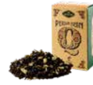
ペルシアンクイーン ¥700 (税込¥770)

ダージリンにドライカモミールをブレンドしました。 香料は一切使わないナチュラルフレーバーは リンゴのような甘い薫り。