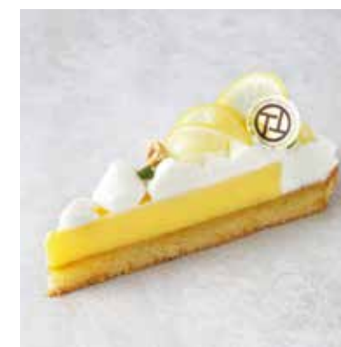
Tarte au citron 瀬戸内レモンのタルト ¥800 (税込¥880)