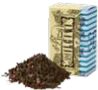
ニルギリ ¥600 (税込¥660)

まろやかな味わいとしっかりしたコクが、濃厚な ケーキにも負けない美味しさです。ミルクを たっぷり入れて、茶葉特有の甘みを感じてください。