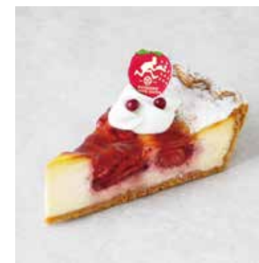
Chaperon シャペロン ¥700 (税込¥770)