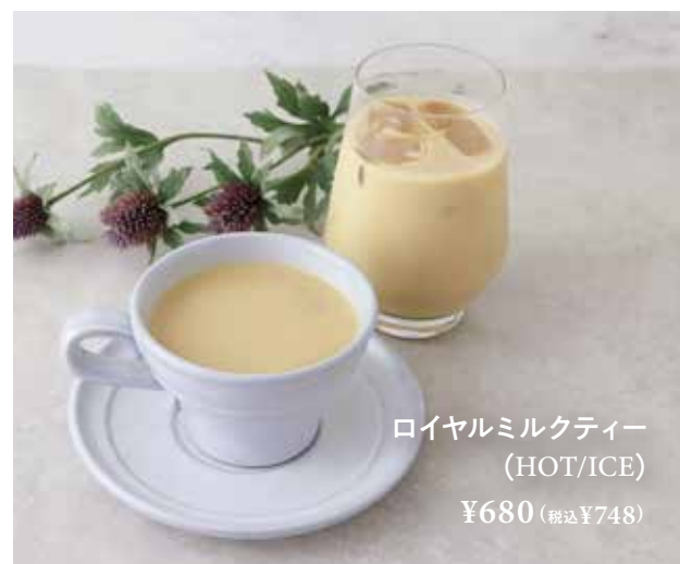
ロイヤルミルクティー (HOT/ICE) ¥680 (税込¥748)