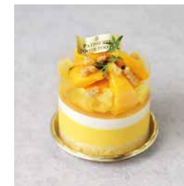
Parfait パルフェ ~マンゴーとココナッツ~ ¥1100 (税込¥1200)