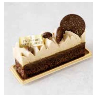
Caramel mocha キャラメルモカ ¥680 (税込¥748)