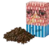
アッサム ¥650 (税込¥715)

まろやかな味わいとしっかりしたコクが、濃厚な ケーキにも負けない美味しさです。ミルクを たっぷり入れて、茶葉特有の甘みを感じてください。