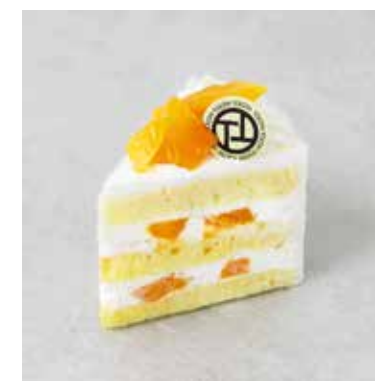
Gâteau à la mangue マンゴースョートケーキ ¥800 (税込¥880)