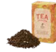
ジンジャー ¥700 (税込¥770)

バラの花びらとオレンジピールを烏龍茶にブレンド。 バラの香りと爽やかなオレンジの風味が こころと身体をリラックスさせてくれます。