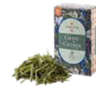
グレイグラス ¥750 (税込¥825)

ハーブベースのフレーバーティー。 蘭の花束を手にしたような、ロマンチックな花香と マンダリンのフレッシュな香りが特徴的。