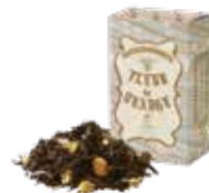
フルールドオレンジ ¥700 (税込¥770)

バニラの香りとアッサムティーのマリアージュ。 ミルクを合わせれば芳ばしいビターアーモンドの 風味が口いっぱいに広がります。