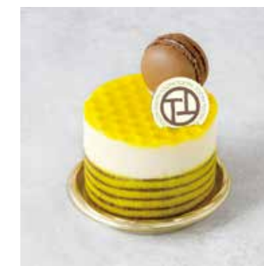
Citron rare シトロンレア ¥680 (税込¥748)