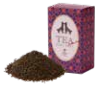
アールグレイ ¥650 (税込¥715)

セイロンティーに清涼感あふれる ベルガモット柑橘系の香りをつけました。 自然で落ち着きのある芳香をお楽しみください。