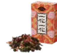
花花 (ホアホア) ¥650 (税込¥715)

バラの花びらとオレンジピールを烏龍茶にブレンド。 バラの香りと爽やかなオレンジの風味が こころと身体をリラックスさせてくれます。