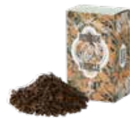
アマンドバニージュ ¥700 (税込¥770)

バニラの香りとアッサムティーのマリアージュ。 ミルクを合わせれば芳ばしいビターアーモンドの 風味が口いっぱいに広がります。