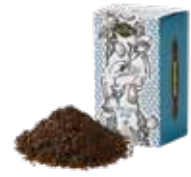
TOOTH TOOTH ブレンド ¥600 (税込¥660)

茶葉の持つ特性を飲み比べてください。どんなお菓子にも良く合うスタンダードティーです。