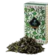
Earl grey japonais ㊦ アールグレイ ジャポネ

グレイ伯爵へ敬意を込めた、トラディショナルな アールグレイ。キーンにベルガモットを着香した フレッシュでありながらボディ感のある味わい。