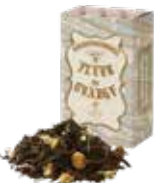
Fleur de orange ㊦ フルールド オランジェ

バニラの香りとアッサムティーのマリアージュ。 ミルクを合わせれば芳ばしいビターアーモンドの 風味が口いっぱいに広がります。