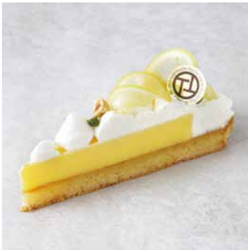
Tarte au citron 瀬戸内レモンのタルト