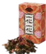
Hoa-hoa 花花 (ホアホア) ¥650 (税込¥715)

バラの花びらとオレンジピールを烏龍茶にブレンド。バラの香りと爽やかなオレンジの風味がこころと身体をリラックスさせてくれます。