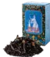
Portrait de earl grey ㊦ アールグレイの肖像

すっきりとした薫りとほのかな甘みが心地よい オレンジフレーバーを、烏龍茶葉にあわせました。