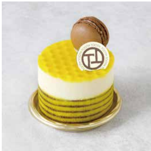
Citron rare シトロンレア

和栗と洋栗をあわせた 風味豊かなモンブランクリームに カシスの爽やかさがアクセント