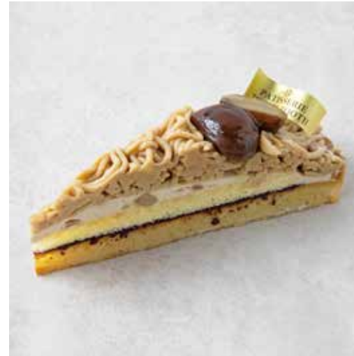
Tarte au mont blanc タルトモンブラン