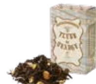
🍵 フルールドオランジェ ¥700 (税込¥770)

バニラの香りとアッサムティーのマリアージュ。 ミルクを合わせれば芳ばしいビターアーモンドの 風味が口いっぱいに広がります。