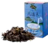
🍵 風海木 ¥750 (税込¥825)

茶葉が醸し出すほのかな甘みは フルーツとの相性ピタリ。 さっぱりした香りと旨みが口の中に広がります。