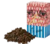
アッサム ¥650 (税込¥715)

まろやかな味わいとしっかりしたコクが、濃厚な ケーキにも負けない美味しさです。ミルクを たっぷり入れて、茶葉特有の甘みを感じて下さい。