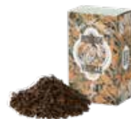
🍵 アマンドバニユ ¥700 (税込¥770)

バニラの香りとアッサムティーのマリアージュ。 ミルクを合わせれば芳ばしいビターアーモンドの 風味が口いっぱいに広がります。