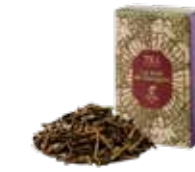
🍵 ゴーギャンの森 ¥750 (税込¥825)

スパイスの女王カルダモンをベースにした エキゾチックなブレンドティーです。 ミルクと合わせてお召し上がりください。