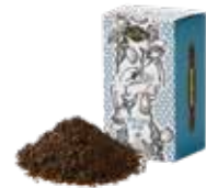
TOOTH TOOTH ブレンド ¥600 (税込¥660)

茶葉の持つ特性を飲み比べてください。どんなお菓子にも良く合うスタンダードティーです。