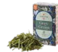
🍵 グレイグラス ¥750 (税込¥825)

ハーブベースのフレーバーティー。 蘭の花束を手にしたような、ロマンチックな花香と マンダリンのフレッシュな香りが特徴的。