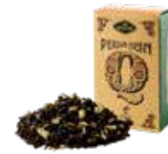
🍵 ペルシアンクイーン ¥700 (税込¥770)

ダージリンにドライカモミールをブレンドしました。 香料を一切使わないナチュラルフレーバーは リンゴのような甘い薫り。