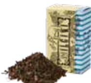
ニルギリ ¥600 (税込¥660)

まろやかな味わいとしっかりしたコクが、濃厚な ケーキにも負けない美味しさです。ミルクを たっぷり入れて、茶葉特有の甘みを感じて下さい。