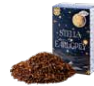
🍵 ステラバイアールグレイ ¥700 (税込¥770)

ルイボスベースのアールグレイ。ほのかな甘さと ベルガモットのフレッシュさがマッチした一杯。 食事に合わせても◎