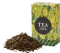
シトロンシュプリーム ¥650 (税込¥715)

セイロンティーに清涼感あふれる ベルガモット柑橘系の香りを付けました。 自然で落ち着いた香りをお楽しみください。