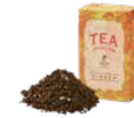
🍵 ジンジャー ¥700 (税込¥770)

バラの花びらとオレンジピールを烏龍茶にブレンド。 バラの香りと爽やかなオレンジの風味が こころと身体をリラックスさせてくれます。