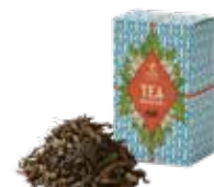
🍵 ダージリン ¥750 (税込¥825)

すっきりとした優雅な薫りとマイルドな口当たりは 「紅茶のブルーマウンテン」のよう。 ストレートはもちろん、ミルクとの相性も抜群です。