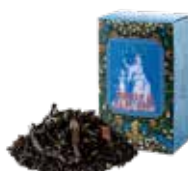
🍵 アールグレイの肖像 ¥750 (税込¥825)

すっきりとした薫りとほのかな甘みが心地よい オレンジフレーバーを、烏龍茶葉にあわせました。