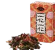
花花 (ホアホア) ¥650 (税込¥715)

バラの花びらとオレンジピールを烏龍茶にブレンド。 バラの香りと爽やかなオレンジの風味が こころと身体をリラックスさせてくれます。