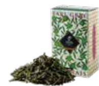
🍵 アールグレイジャポネ ¥700 (税込¥770)

グレイ伯爵へ敬意を込めた、トラディショナルな アールグレイ。キーンにベルガモットを着香した フレッシュでありながらボディ感のある味わい。