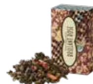
🍵 ブリアンローズ ¥700 (税込¥770)

ケニアティーに粗挽きショウガを合わせました。 ミルクをたっぷり入れてコクのある まろやかなジンジャーティーを。