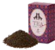
アールグレイ ¥650 (税込¥715)

セイロンティーに清涼感あふれる ベルガモット柑橘系の香りを付けました。 自然で落ち着いた香りをお楽しみください。