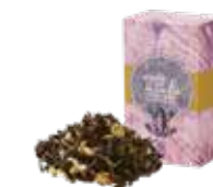
🍵 カモミールダージリン ¥700 (税込¥770)

「ブルガリアンローズ」から抽出したふんわり 甘い薫りと、優しくて華やかな風味が エレガントなティータイムを演出します。