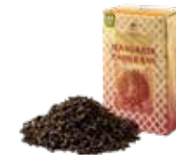
🍵 マンダリンオレンジ ¥700 (税込¥770)

ルイボスベースのアールグレイ。ほのかな甘さと ベルガモットのフレッシュさがマッチした一杯。 食事に合わせても◎