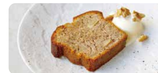
りんごのパウンドケーキ 紅茶とスパイスの風味 バニラアイス添え