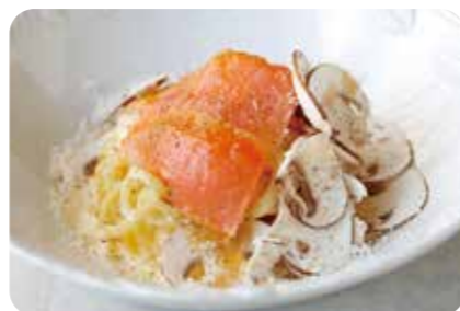
燻製したノルウェーサーモンと 六甲マッシュルームのカルボナーラ (+550yen)