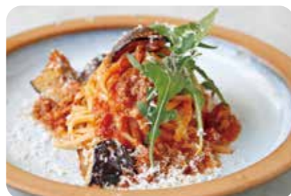
サルシッチャと揚げなすの ラグーソースパスタ