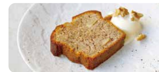
りんごのパウンドケーキ 紅茶とスパイスの風味 バニラアイス添え