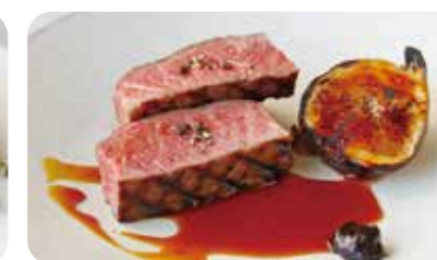
黒毛和牛のグリル 無花果のロースト 黒にんにくとバルサミコのピュレ (+1210yen)