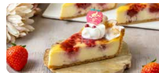
パティスリートゥーストウースのケーキ (+660yen)