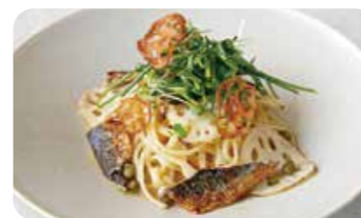
イワシと和ハーブ・ 蓮根のオイルソースパスタ すだちの香り