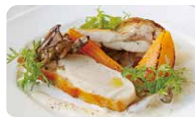
丹波鶏と秋野菜のロースト 白ワイン香るクリームソース