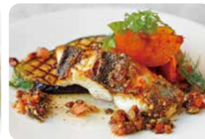
本日鮮魚のグリル 胡桃の焦がしバターソース (+660yen)