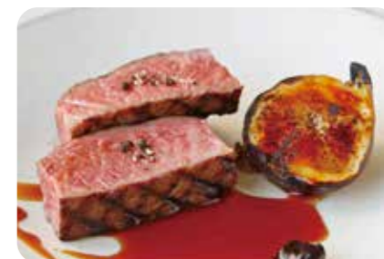
黒毛和牛のグリル 無花果のロースト 黒にんにくとバルサミコのピュレ (+1800yen)