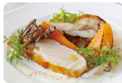
丹波鶏と秋野菜のロースト 白ワイン香るクリームソース