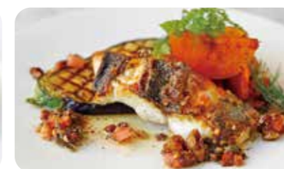
本日鮮魚のグリル 胡桃の焦がしバターソース (+330yen)