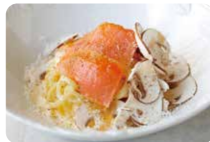
燻製したノルウェーサーモンと 六甲マッシュルームのカルボナーラ (+550yen)