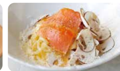
燻製したノルウェーサーモンと 六甲マッシュルームのカルボナーラ (+330yen)