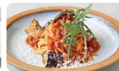
サルシッチャと揚げなすの ラグーソースパスタ