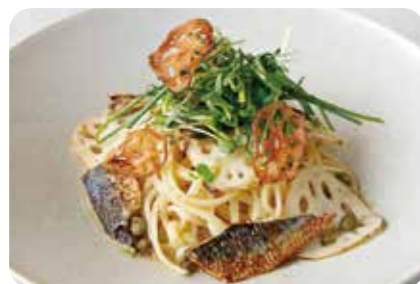
イワシと和ハーブ・ 蓮根のオイルソースパスタ すだちの香り