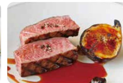
黒毛和牛のグリル 無花果のロースト 黒にんにくとバルサミコのピュレ (+1800yen)