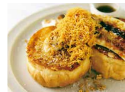
French Toast with Brown Cheese and Caramel Banana