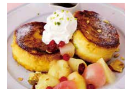
Peach French Toast