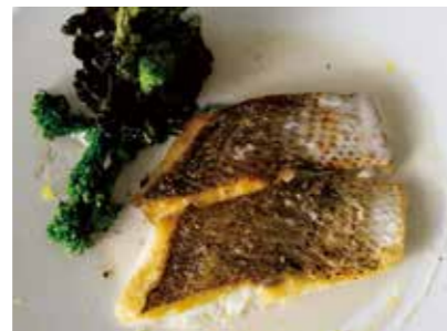
Today's fresh fish grilled in a stone oven with yuzu flavor beurre blanc sauce 本日鮮魚の石窯グリル 檸檬のヴァンプランソース 2,400 (2,640)