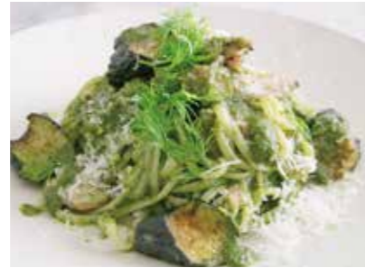
Homemade tuna confit and fried eggplant genovese 自家製マグロコンフィと 揚げ茄子のジェノベーゼ 1,900 (2,090)