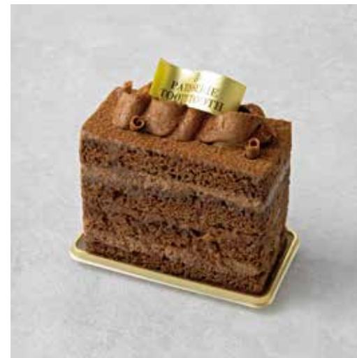
Chocolate Chocolate ショコラショコラ