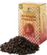
Mandarin rang rang マンダリンランラン ¥700 (税込¥770)

ルイボスベースのアールグレイ。ほのかな甘さとベルガモットのフレッシュさがマッチした一杯。食事に合わせても◎