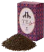
Earl grey (B-O-P) アールグレイ