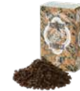
Amande vanille ㊦ アマンド バニージュ