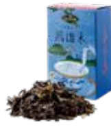
Fûki ㊦ 風海木

茶葉が醸し出すほのかな甘みは フルーツとの相性ピッタリ。 さっぱりした香りと旨みが口の中に広がります。