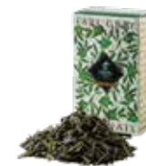
Earl grey japonais ㊦ アールグレイ ジャポネ

グレイ伯爵へ敬意を込めた、トラディショナルな アールグレイ。キムンにベルガモットを着香した フレッシュでありながらボディ感のある味わい。