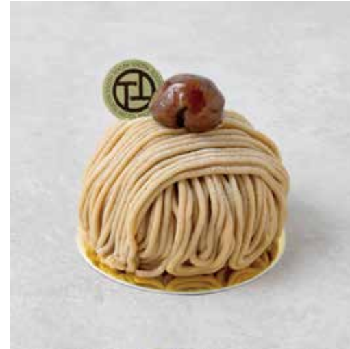
Mont blanc モンブラン