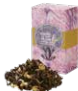
Chamomile darjeeling カモミールダーズリン ¥700 (税込¥770)

「ブルガリアンローズ」から抽出したふんわり甘い薫りと、優しくて華やかな風味がエレガントなティータイムを演出します。