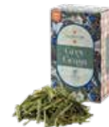
Gray grass グレイグラス ¥750 (税込¥825)

ハーブベースのフレーバーティー。蘭の花束を手にしたような、ロマンチックな花香とマンダリンのフレッシュな香り特徴的。