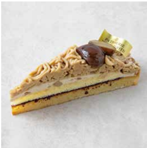
Tarte au mont blanc タルトモンブラン