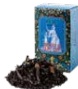
Portrait de earl grey ㊦ アールグレイの肖像

すっきりとした薫りとほのかな甘みが心地よい オレンジフレーバーを、烏龍茶葉にあわせました。