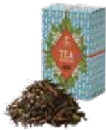
Darjeeling ㊦ ダージリン

すっきりとした優雅な薫りとマイルドな口あたりは 「紅茶のブルーマウンテン」のよう。 ストレートはもちろん、ミルクとの相性も抜群です。