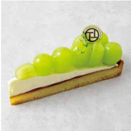
Tarte aux muscats シャインマスカットのタルト