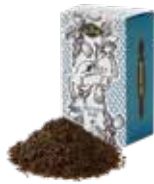
TOOTH TOOTH blend TOOTH TOOTH ブレンド

茶葉の持つ特性を飲み比べてください。どんなお菓子にも良く合うスタンダードなお茶です。