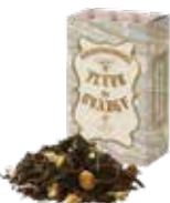
Fleur de orange ㊦ フルールド オランジェ

バニラの香りとアッサムティーのマリアージュ。 ミルクを合わせれば芳ばしいビターアーモンドの 風味が口いっぱいに広がります。