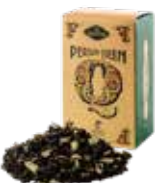
Persian queen ペルシアンクイーン ¥700 (税込¥770)

ダーズリンにドライカモミールをブレンドしました。香料を一切使わないナチュラルフレーバーはリンゴのような甘い薫り。