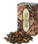
Brilliant rose ブリアンローズ ¥700 (税込¥770)

ケニアティーに粗挽きショウガを合わせました。ミルクをたっぷり入れてココのあるまろやかなジンジャーティーを。