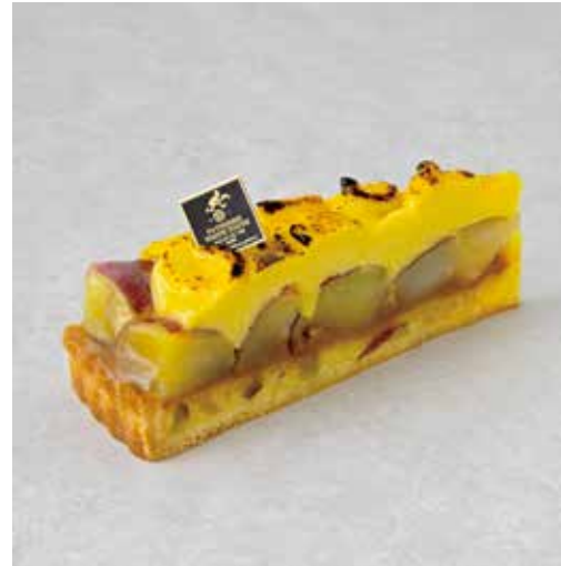
Tarte aux patates douces さつまいものタルト