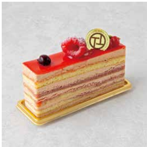
Gâteau framboise ガトーフランボワーズ

和栗と洋栗をあわせた 風味豊かなモンブランクリームに カシスの爽やかさがアクセント