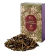
La forêt de gauguin ゴーギャンの森 ¥750 (税込¥825)

スパイスの女王カルダモンをベースにしたエキゾチックなブレンドティーです。ミルクと合わせてお召し上がりください。