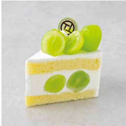
Gâteau aux muscats シャインマスカットのショートケーキ