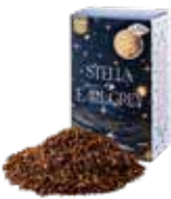
Stella by earl gray ステラバイアールグレイ ¥700 (税込¥770)

ルイボスベースのアールグレイ。ほのかな甘さとベルガモットのフレッシュさがマッチした一杯。食事に合わせても◎