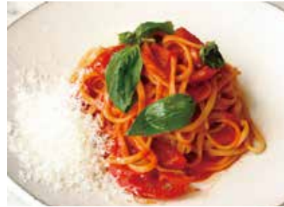
With fresh tomatoes from Kobe Basil Pomodoro 神戸産フレッシュトマトと バジリコのポモドーロ 1,800 (1,980)