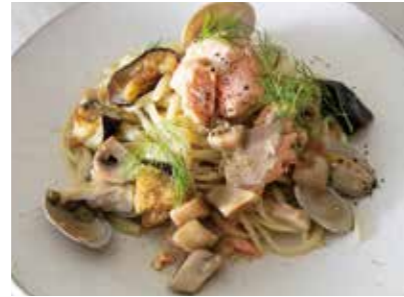
Pasta with salmon, Clams and Porcini mushrooms in oil sauce 鮭とあさり、ポルチーニ茸の オイルソースパスタ 1,900 (2,090)