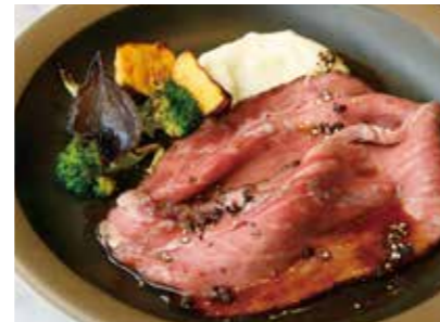
Wagyu roast beef 和牛のローストビーフ 2,800 (3,080)