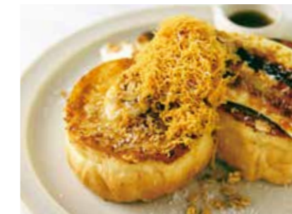
French Toast with Brown Cheese and Caramel Banana