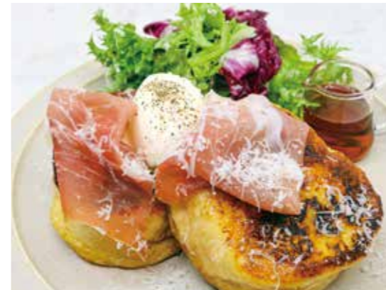
French Toast with Prosciutto, Sour Cream, and Salad