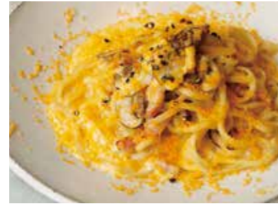
Rokko mushrooms and bacon TOOTHTOOTH carbonara 六甲マッシュルームとベーコンの TOOTHTOOTH カルボナーラ 2,100 (2,310)