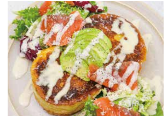
Caesar Salad French Toast with Smoked Salmon and Avocado