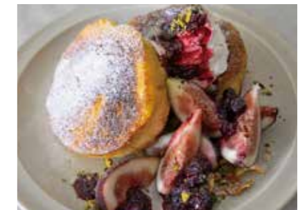
French toast with figs and berries