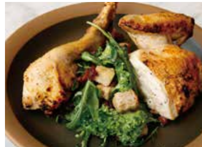
Kiln-roasted domestic chicken rotisserie chicken 国産鶏の窯焼き ロティサリーチキン 2,200 (2,420)