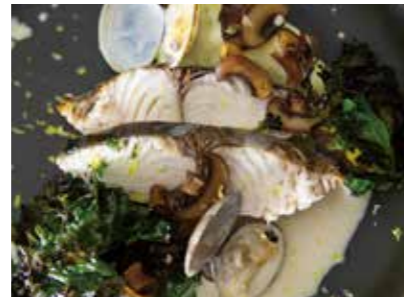
Today's fresh fish grilled in a stone oven with yuzu flavor beurre blanc sauce 本日鮮魚の石窯グリル 檸檬のヴァンプランソース 2,400 (2,640)