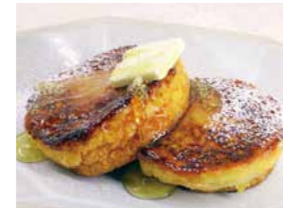
Brulee French Toast with Rokko Honey