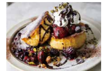
Chocolate French Toast