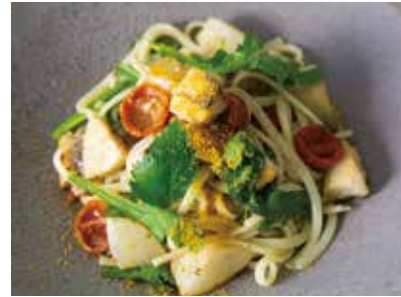
Yellowtail, turnip and chrysanthemum in oil sauce topped with dried mullet roe 鱈とかぶら、春菊のオイルソース カラスミがけ 1,900 (2,090)