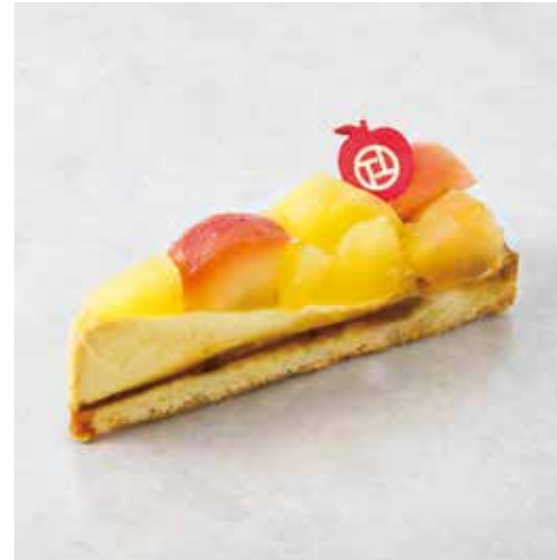
Tarte aux pommes タルトポンム