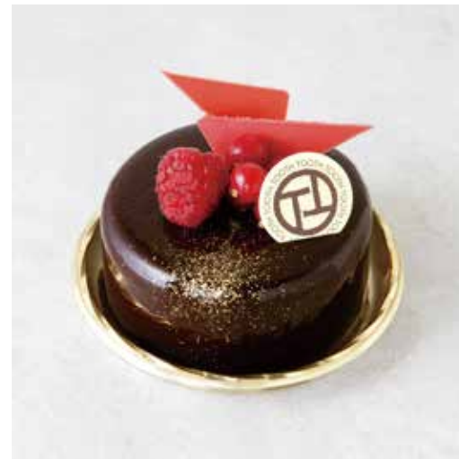
Rubis chocolate ルビーショコラ