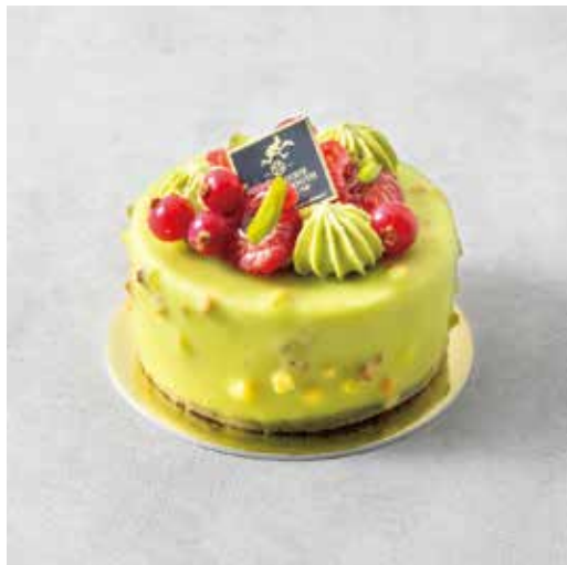
Pistache palais ピスタチオパレ

和栗と洋栗をあわせた 風味豊かなモンブランクリームに カシスの爽やかさがアクセント