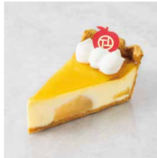
Chaperon りんごのシャペロン