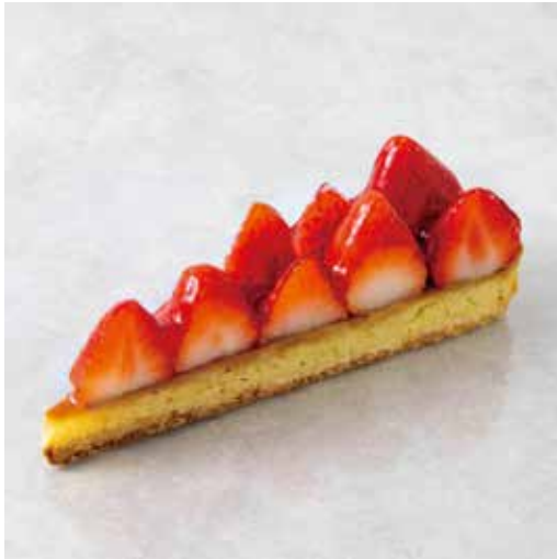
Tarte aux fraises タルトフレーズ