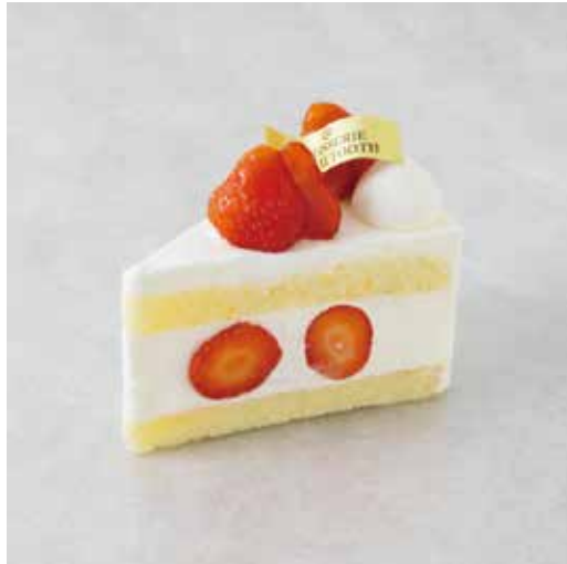
Gâteau aux fraises ガトーフレーズ