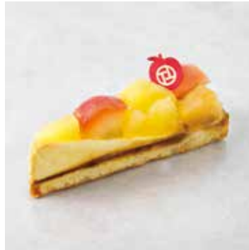
Tarte aux Pommes タルトポムム