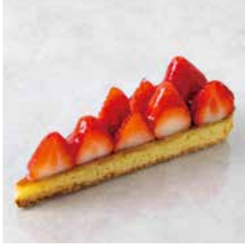
Tarte aux Fraise タルトフレーズ