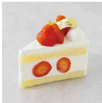
Gâteau aux Fraise ガトーフレーズ

和栗と洋栗をあわせた風味豊かな モンブランクリームに カシスの爽やかさがアクセント