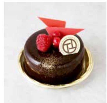
Rubis Chocolat ルビーショコラ