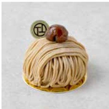
Mont Blanc モンブラン