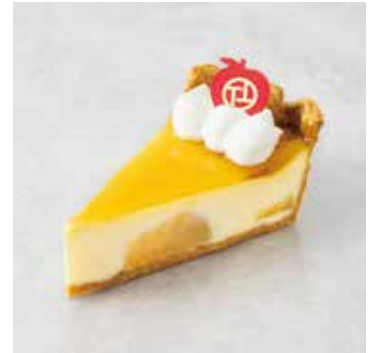
Chaperon りんごのシャペロン