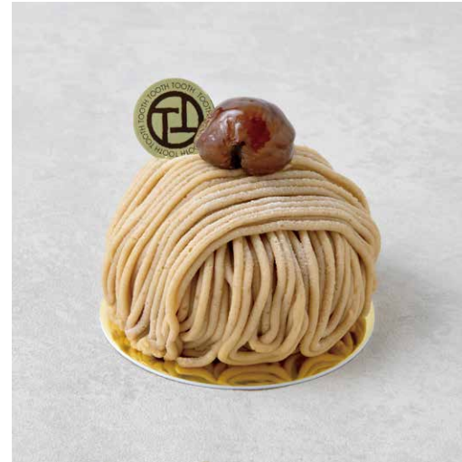
Mont blanc モンブラン