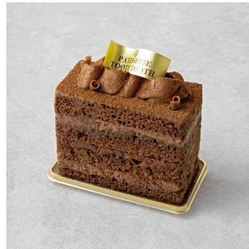
Chocolate chocolate ショコラショコラ