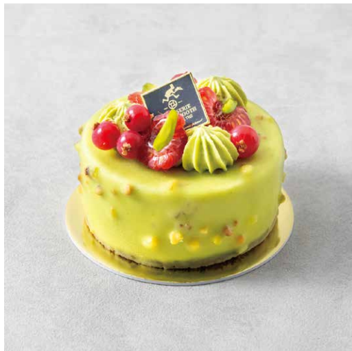
Pistache palais ピスタチオパレ

和栗と洋栗をあわせた 風味豊かなモンブランクリームに カシスの爽やかさがアクセント