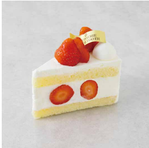
Gâteau aux fraises ガトーフリーズ