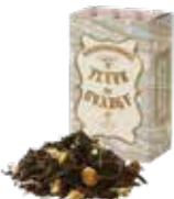
Fleur de orange フルールド オランジェ

バニラの香りとアッサムティーのマリアージュ。 ミルクを合わせれば芳ばしいビターアモンドの 風味が口いっぱいに広がります。