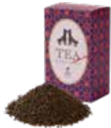
Earl grey (B-O-P) アールグレイ