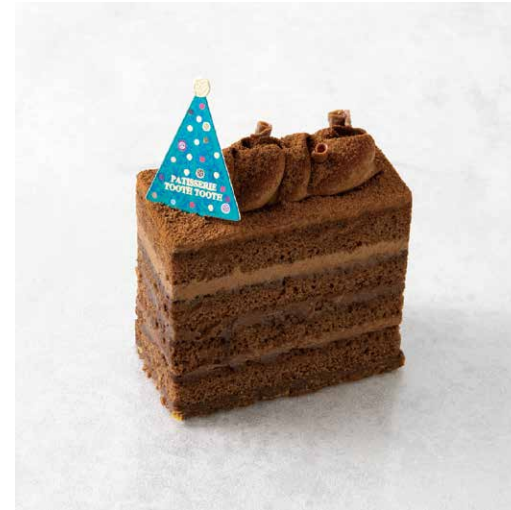
Chocolat Noël ショコラ・ノエル