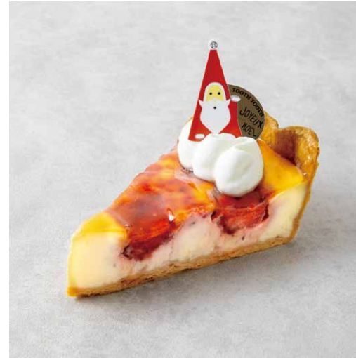
Chaperon Noël シャペロン・ノエル

香ばしいシュクレタルト生地と アーモンドクリームに 甘酸っぱいいちごをたっぷりと