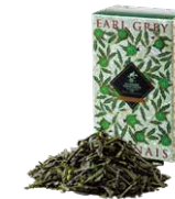
Earl grey japonais アールグレイ ジャポネ

グレイ伯爵へ敬意を込めた、トラディショナルな アールグレイ。キムンにベルガモットを着香した フレッシュでありながらボディ感のある味わい。