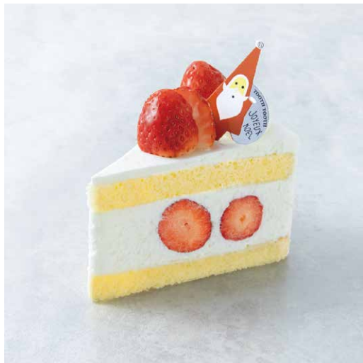
Gâteau aux fraises Noël ガトーフレーズ・ノエル