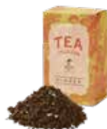
Ginger ジンジャー ¥700 (税込¥770)

バラの花びらとオレンジピールを烏龍茶にブレンド。バラの香りと爽やかなオレンジの風味が、心と身体をリラックスさせてくれます。