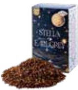
Stella by earl gray ステラバイアールグレイ ¥700 (税込¥770)

ルイボスベースのアールグレイ。ほのかな甘さとベルガモットのフレッシュさがマッチした一杯。食事に合わせても◎