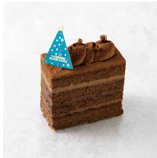
Chocolat Noël ショコラ・ノエル