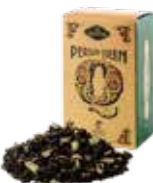
Persian queen ペルシアンクイーン ¥700 (税込¥770)

ダーズリンにドライカモミールをブレンドしました。香料を一切使わないナチュラルフレーバーは、リンゴのような甘い薫り。