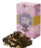
Chamomile darjeeling カモミールダーズリン ¥700 (税込¥770)

「ブルガリアンローズ」から抽出したふんわり甘い薫りと、優しくて華やかな風味がエレガントなティータイムを演出します。