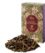
La forêt de gauguin ゴーギャンの森 ¥700 (税込¥770)

スパイスの女王カルダモンをベースにしたエキゾチックなブレンドティーです。ミルクと合わせてお召し上がりください。