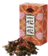
Hoa-hoa 花花 (ホアホア) ¥700 (税込¥770)

バラの花びらとオレンジピールを烏龍茶にブレンド。バラの香りと爽やかなオレンジの風味が、心と身体をリラックスさせてくれます。