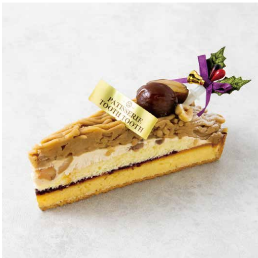
Tarte au mont blanc Noël タルトモンブラン・ノエル

ミルクィなクリームといちごを ブリゼ生地で焼き上げた、 いちごミルク仕上げのベイクドチーズケーキ