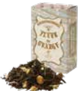
Fleur de orange フルールド オランジェ

バニラの香りとアッサムティーのマリアージュ。 ミルクを合わせれば芳ばしいビターアモンドの 風味が口いっぱいに広がります。