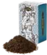
TOOTH TOOTH blend TOOTH TOOTH ブレンド

茶葉の持つ特性を飲み比べてください。どんなお菓子にも良く合うスタンダードなお茶です。