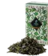
Earl grey japonais アールグレイ ジャポネ

グレイ伯爵へ敬意を込めた、トラディショナルな アールグレイ。キーンにベルガモットを着香した フレッシュでありながらボディ感のある味わい。