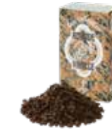
Amande vanille アモンド バニョーユ