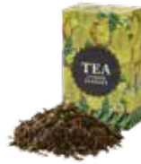
Citron supreme シトロンシュプリーム

セイロンティーに清涼感あふれる ベルガモット柑橘系の香りを付けました。 自然で落ち着きのある芳香をお楽しみください。