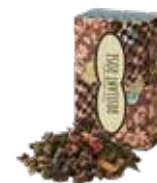
Brilliant rose ブリアンローズ ¥700 (税込¥770)

マイルドな茶葉に粗挽きショウガを合わせました。ミルクをたっぷり入れてコクのある、まろやかなジンジャーティーを。