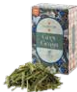
Gray grass グレイグラス ¥700 (税込¥770)

ルイボスベースのアールグレイ。ほのかな甘さとベルガモットのフレッシュさがマッチした一杯。食事に合わせても◎