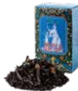
Portrait de earl grey アールグレイの肖像

すっきりとした薫りとほのかな甘みが心地よい オレンジフレーバーを、烏龍茶葉にあわせました。