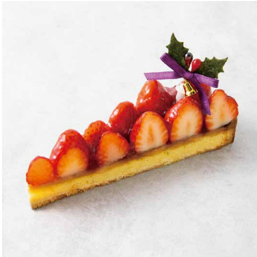
Tarte aux fraises Noël タルトフリーズ・ノエル