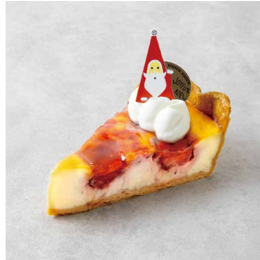
Chaperon Noël シャペロン・ノエル

香ばしいシュクレタルト生地と アーモンドクリームに 甘酸っぱいいちごをたっぷりと