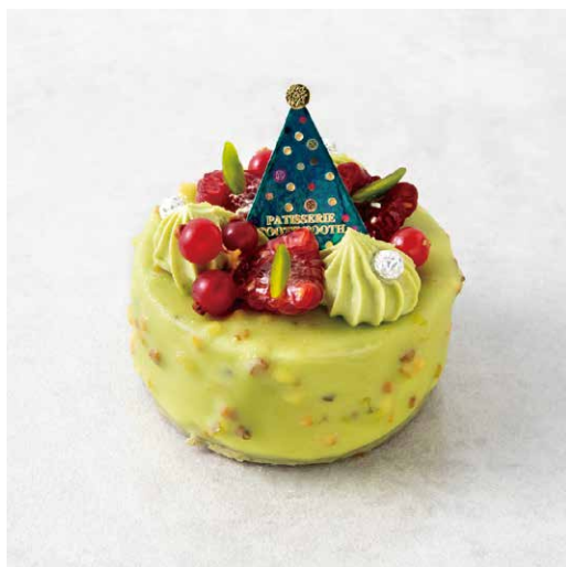
Pistache Noël ピスタチオ・ノエル