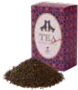
Earl grey (B-O-P) アールグレイ