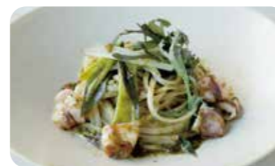
ヤリイカと九条ねぎ、 海苔のペペロンチーノ