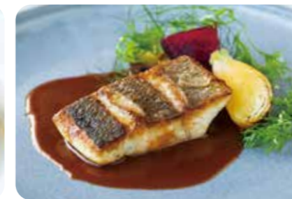
本日の鮮魚のポワレ アメリカーナソース