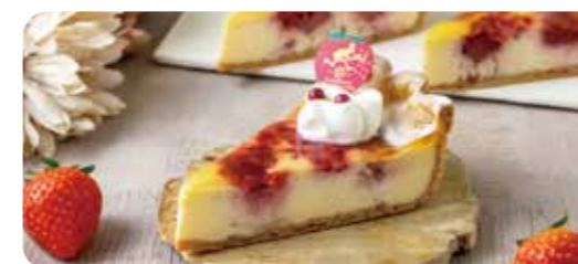
パティスリー、トースト、ワッフルのケーキ +600(660) ※リストからお選びください