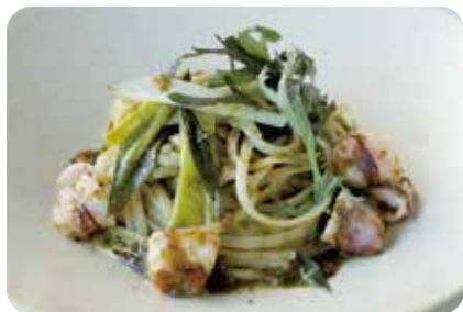
ヤリイカと九条ねぎ、 海苔のペペロンチーノ