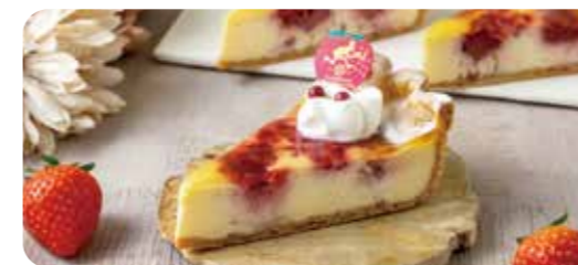
パティスリートウーストウースのケーキ +600(660) ※リストからお選びください