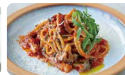
神戸ポークベーコンと蓮根の トマトソースパスタ