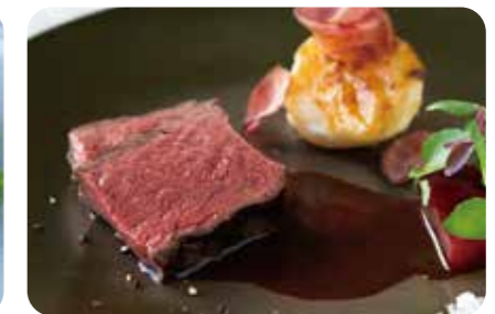
黒毛和牛のグリル 赤ワインソース