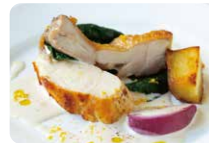
丹波鶏と冬野菜のロースト 柚子香る白ワインソース