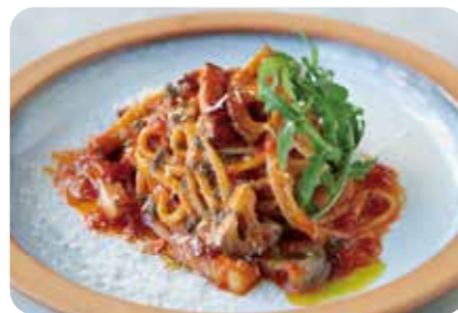
神戸ポークベーコンと蓮根の トマトソースパスタ