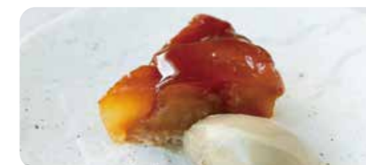
紅玉のタルトタン ほうじ茶アイス添え