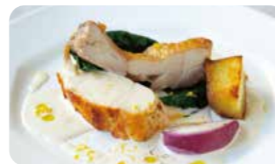
丹波鶏と冬野菜のロースト 柚子香る白ワインソース