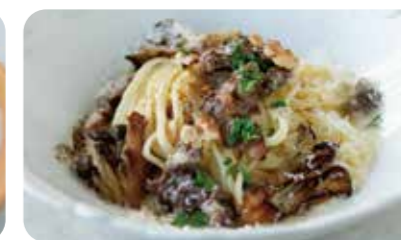
蝦夷鹿のサルシッチャと 茸のクリームパスタ (+330yen)