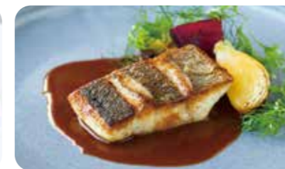
本日の鮮魚のポワレ アメリケーヌソース (+330yen)