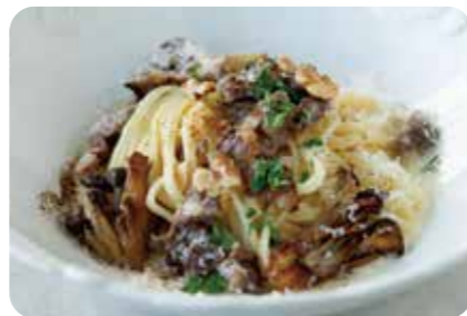
蝦夷鹿のサルシッチャと 茸のクリームパスタ