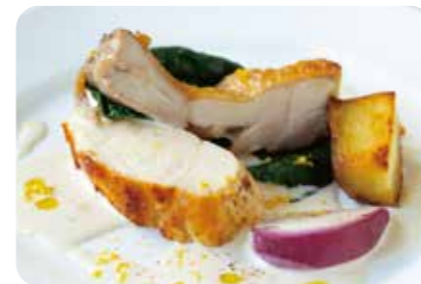
丹波鶏と冬野菜のロースト 柚子香る白ワインソース