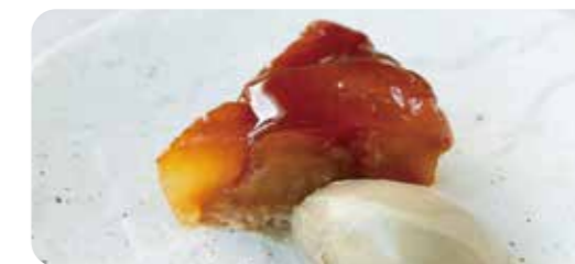
紅玉のタルトタン ほうじ茶アイス添え