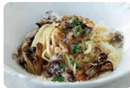
蝦夷鹿のサルシッチャと 茸のクリームパスタ