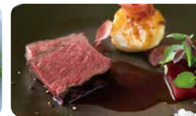
黒毛和牛のグリル 赤ワインソース (+1210yen)