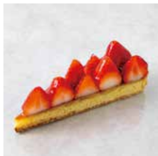
Tarte aux Fraise タルトフレーズ