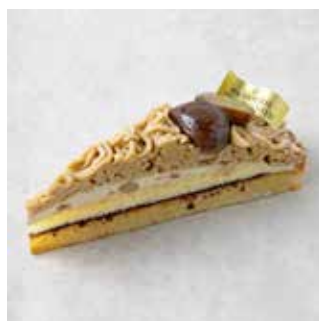
Tarte au Montblanc タルトモンブラン