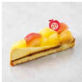
Tarte aux Pomme タルトポムム