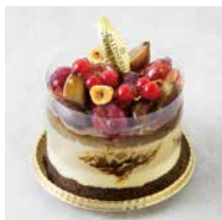
Parfait パルフェ～栗とぶどう～