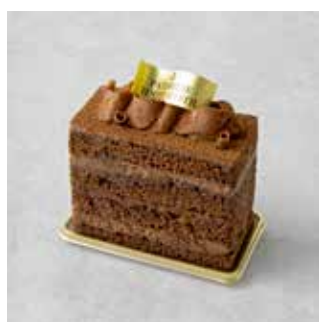
Chocolat Chocolat ショコラ ショコラ