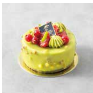
Pistache Palais ピスタチオパレ