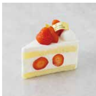
Gâteau aux Fraises ガトーフレーズ