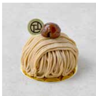
Mont Blanc モンブラン