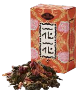
Hoa-hoa 花花 (ホアホア) ¥700 (税込¥770)

バラの花びらとオレンジピールを烏龍茶にブレンド。バラの香りと爽やかなオレンジの風味が、心と身体をリラックスさせてくれます。