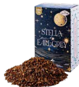
Stella by earl gray ステラバイアールグレイ ¥700 (税込¥770)

ルイボスベースのアールグレイ。ほのかな甘さとベルガモットのフレッシュさがマッチした一杯。食事に合わせても◎