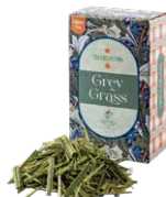
Gray grass グレイグラス ¥700 (税込¥770)

ルイボスベースのアールグレイ。ほのかな甘さとベルガモットのフレッシュさがマッチした一杯。食事に合わせても◎