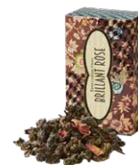
Brilliant rose ブリアンローズ ¥700 (税込¥770)

マイルドな茶葉に粗挽きショウガを合わせました。ミルクをたっぷり入れてコクのある、まろやかなジンジャーティーを。