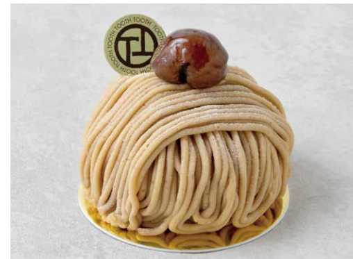
Mont blanc モンブラン