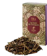
La forêt de gauguin ゴーギャンの森 ¥700 (税込¥770)

スパイスの女王カルダモンをベースにしたエキゾチックなブレンドティーです。ミルクと合わせてお召し上がりください。