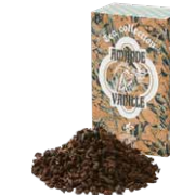
Amande vanille アモンド バニーク