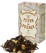
Fleur de orange フルールド オランジェ

バニラの香りとアッサムティーのマリアージュ。 ミルクを合わせれば芳ばしいビターアモンドの 風味が口いっぱいに広がります。