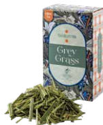
Gray grass グレイグラス ¥700 (税込¥770)

ルイボスベースのアールグレイ。ほのかな甘さとベルガモットのフレッシュさがマッチした一杯。食事に合わせても◎