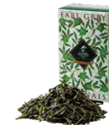
Earl grey japonais アールグレイ ジャポネ

グレイ伯爵へ敬意を込めた、トラディショナルな アールグレイ。キムンにベルガモットを着香した フレッシュでありながらボディ感のある味わい。