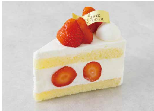
Gâteau aux fraises ガトーフレーズ