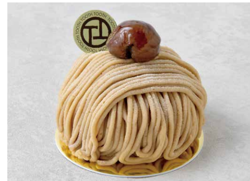
Mont blanc モンブラン