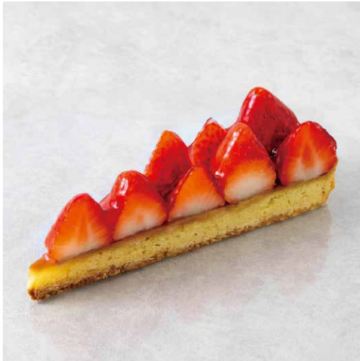
Tarte aux fraises タルトフリーズ