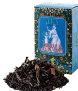
Portrait de earl grey アールグレイの肖像

すっきりとした薫りとほのかな甘みが心地よい オレンジフレーバーを、烏龍茶葉にあわせました。