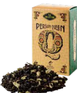
Persian queen ペルシアンクイーン ¥700 (税込¥770)

ダーズリンにドライカモミールをブレンドしました。香料を一切使わないナチュラルフレーバーは、リングのような甘い薫り。