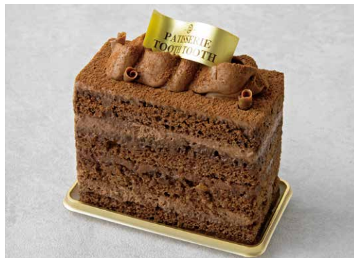
Chocolate chocolate ショコラショコラ