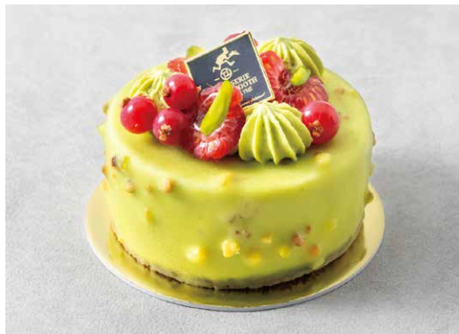
Pistache palais ピスタチオパレ