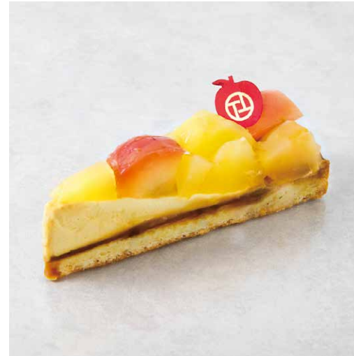
Tarte aux pommes タルトポンム

香ばしいシュクレタルト生地と アーモンドクリームに 甘酸っぱいイチゴをたっぷりと