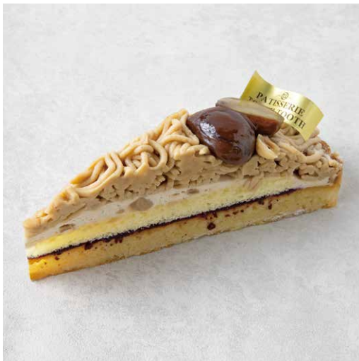
Tarte au mont blanc タルトモンブラン