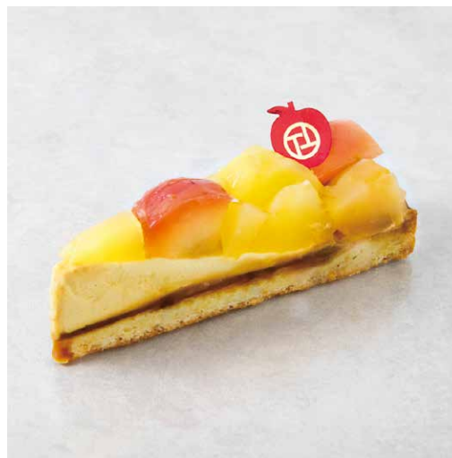
Tarte aux pommes タルトポムム

香ばしいシュクレタルト生地と アーモンドクリームに 甘酸っぱいいちごをたっぷりと