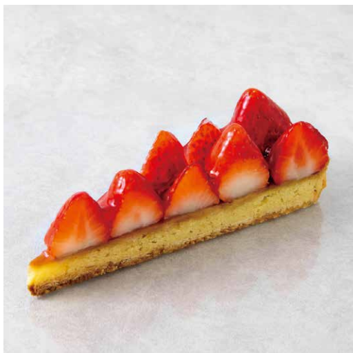
Tarte aux fraises タルトフリーズ