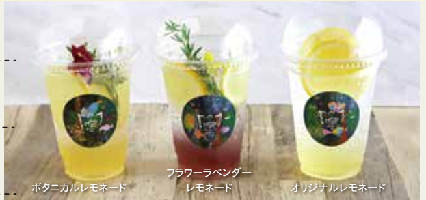
ボタニカルレモネード