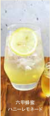
六甲蜂蜜 ハニーレモネード