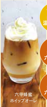
六甲蜂蜜 ホイップオーレ