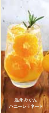
温州みかん ハニーレモネード