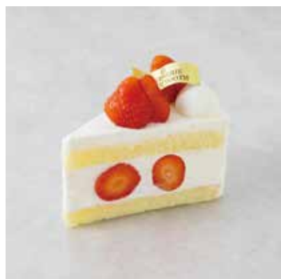
Gâteau aux Fraises ガトーフレーズ 830 [913]