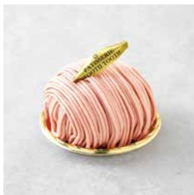
Fraise du Mont Blanc いちごのモンブラン 780 [858]