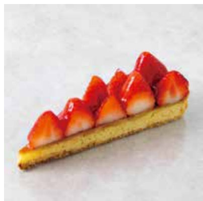
Tarte aux Fraise タルトフレーズ 850 [935]