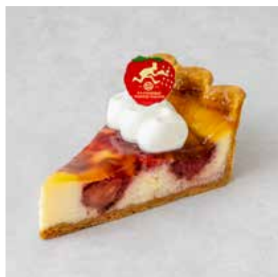
Chaperon シャペロン 720 [792]