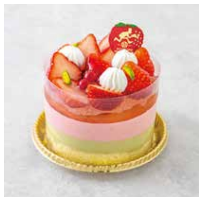
Parfait パルフェ ～いちごとピスタチオ～ 1,600 [1,760]