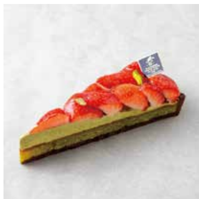
Tarte aux Fraises et Pistaches タルトフレーズ ピスターシュ 850 [935]