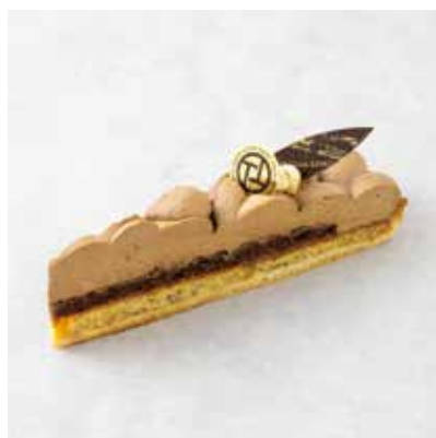
Tarte au Earl Grey タルトアールグレイ 800 [880]