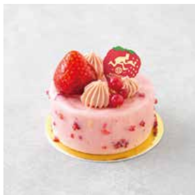
Spécialité 季節のおすすめ Hi - Na ひいな 800 [880]