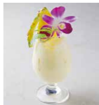
Virgin Piña colada バージンピニャコラーダ パイナップルジュース+ミルク