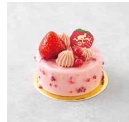
Spiciale 季節のおすすめ Hi - Na ひいな 800 [880]