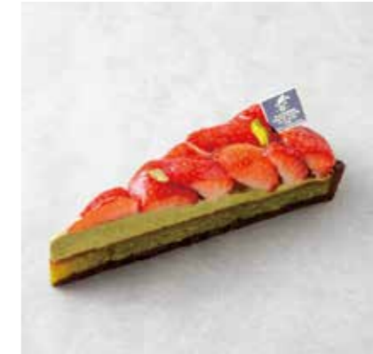
Tarte aux Fraises et Pistaches タルトフレーズ ピスターシュ 850 [935]