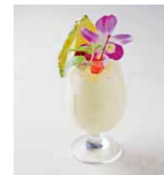
Piña colada ピニャコラーダ ラム+パイナップルジュース+ミルク