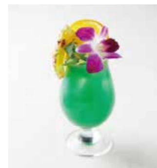
Blue Hawai ブルーハワイ ラム+パイナップルジュース+ブルーキュラソー