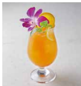
Sunset サンセット オレンジジュース+クランベリージュース