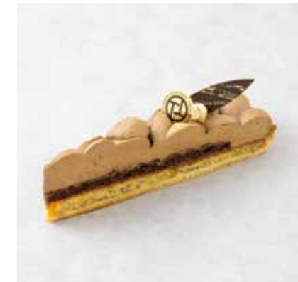
Tarte au Earl Grey タルトアールグレイ 800 [880]