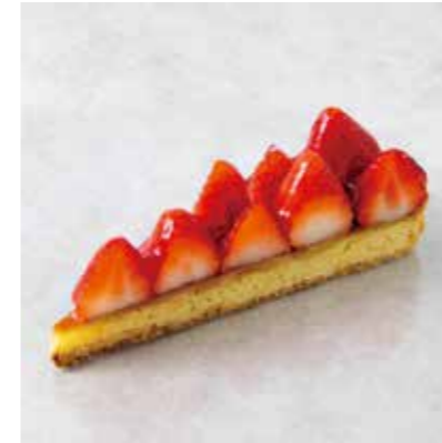
Tarte aux Fraise タルトフレーズ 850 [935]