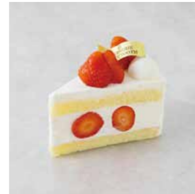
Gâteau aux Fraises ガトーフレーズ 830 [913]