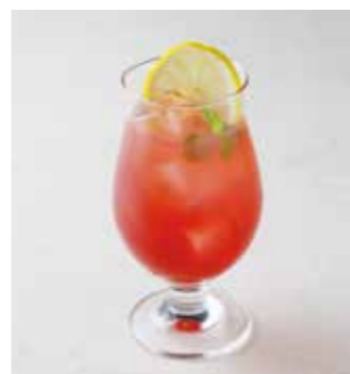
Virgin Breeze バージンブリーズ グレープフルーツジュース +クランベリージュース