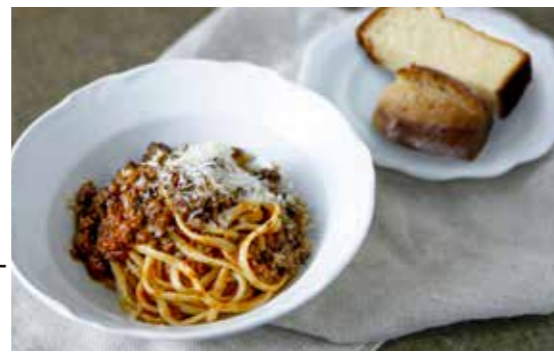
Awaji Island beef meat sauce pasta. 淡路産牛肉のミートソースパスタ