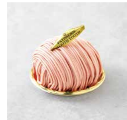
Fraise du Mont Blanc いちごのモンブラン 780 [858]