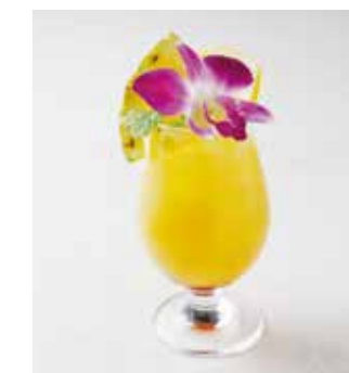
Lovers Holiday ラヴァーズホリデー ラム+パイナップルジュース+グレナデン