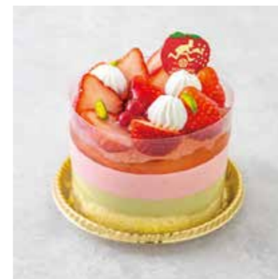
Parfait パルフェ ～いちごとピスタチオ～ 1,600 [1,760]