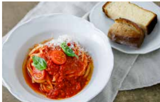
Pomodoro pasta with Awaji Island tomatoes. 淡路島産トマトのポモドーロパスタ