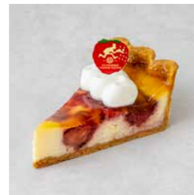
Chaperon シャペロン 720 [792]