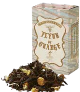
Fleur de orange フルールド オランジェ

バニラの香りとアッサムティーのマリアージュ。 ミルクを合わせれば芳ばしいビターアモンドの 風味が口いっぱいに広がります。