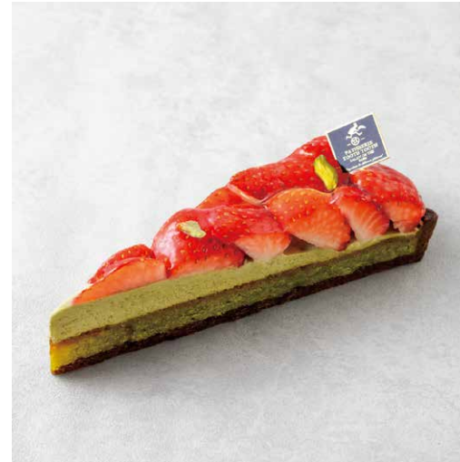
Tarte aux fraises et pistaches タルトフリーズピスターシュ