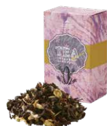
Chamomile darjeeling カモミールダーズリン ¥700 (税込¥770)

「ブルガリアンローズ」から抽出したふんわり甘い薫りと、優しくて華やかな風味がエレガントなティータイムを演出します。