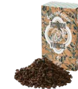
Amande vanille アモンド バニーク