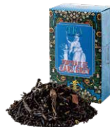
Portrait de earl grey アールグレイの肖像

すっきりとした薫りとほのかな甘みが心地よい オレンジフレーバーを、烏龍茶葉にあわせました。