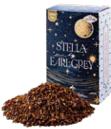
Stella by earl gray ステラバイアールグレイ ¥700 (税込¥770)

ルイボスベースのアールグレイ。ほのかな甘さとベルガモットのフレッシュさがマッチした一杯。食事に合わせても◎