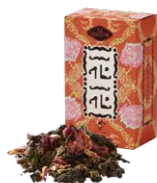
Hoa-hoa 花花 (ホアホア) ¥700 (税込¥770)

バラの花びらとオレンジピールを烏龍茶にブレンド。バラの香りと爽やかなオレンジの風味が、心と身体をリラックスさせてくれます。