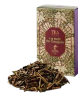
La forêt de gauguin ゴーギャンの森 ¥700 (税込¥770)

スパイスの女王カルダモンをベースにしたエキゾチックなブレンドティーです。ミルクと合わせてお召し上がりください。