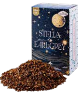
Stella by earl gray ステラバイアールグレイ ¥700 (税込¥770)

ルイボスベースのアールグレイ。ほのかな甘さとベルガモットのフレッシュさがマッチした一杯。食事に合わせても◎