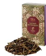
La forêt de gauguin ゴーギャンの森 ¥700 (税込¥770)

スパイスの女王カルダモンをベースにしたエキゾチックなブレンドティーです。ミルクと合わせてお召し上がりください。