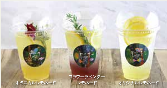
ボタニカルレモネード