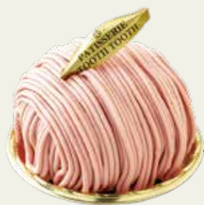
FRAISE DU MONT BLANC いちごのモンブラン