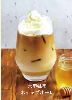
六甲蜂蜜 ホイップオーレ