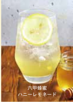
六甲蜂蜜 ハニーレモネード