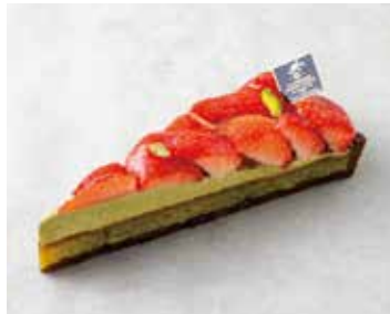
Tarte aux Fraises et Pistaches タルトフレーズピスターシュ 850 [935]