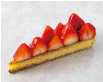
Tarte aux Fraise タルトフレーズ 850 [935]

※お一人様ワンドリンクのご注文をお願いしております Please order one drink per person.