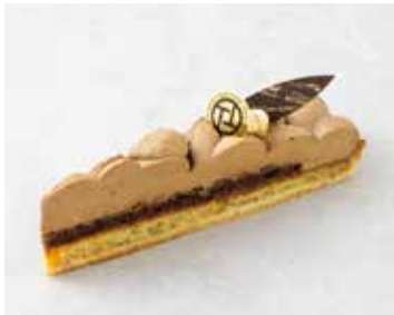
Tarte au Earl Grey タルトアールグレイ 800 [880]