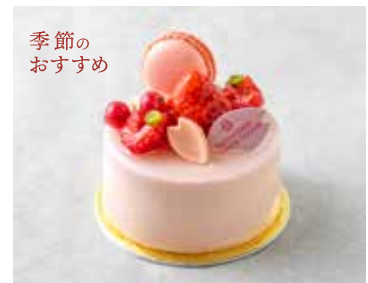
季節の おすすめ Tarte Fraise Pistaches さくらのシャンパーニュ 810 [891]