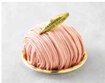
Fraise du Mont Blanc いちごのモンブラン 780 [858]