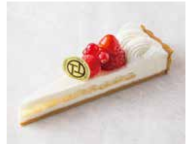
Fromage aux Fraises フレーズ・フロマージュ 740 [814]