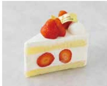
Gâteau aux fraises ガトーフレーズ 830 [913]