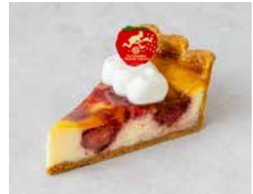
Chaperon シャペロン 720 [792]