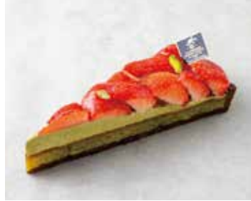
Tarte aux Fraises et Pistaches タルトフレーズピスターシュ 850 [935]