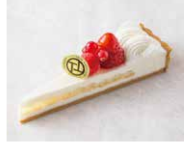
Fromage aux Fraises フレーズ・フロマージュ 740 [814]