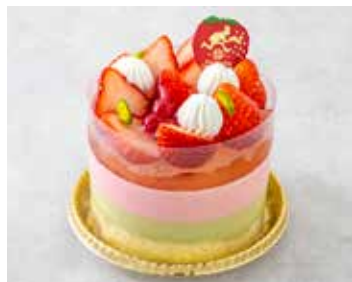
Parfait パルフェ 〜いちごとピスタチオ〜 1,600 [1,760]