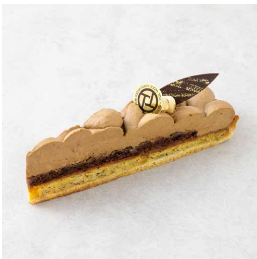
Tarte aux earl grey タルトアールグレイ