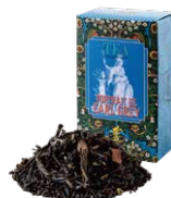
Portrait de earl grey アールグレイの肖像

すっきりとした薫りとほのかな甘みが心地よい オレンジフレーバーを、烏龍茶葉にあわせました。