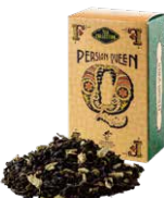
Persian queen ペルシアンクイーン ¥700 (税込¥770)

ダーズリンにドライカモミールをブレンドしました。香料を一切使わないナチュラルフレーバーはリングのような甘い薫り。