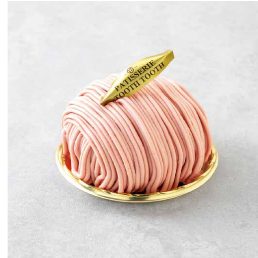
Fraise du mont blanc いちごのモンブラン