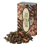
Brilliant rose ブリアンローズ ¥700 (税込¥770)

マイルドな茶葉に粗挽きショウガを合わせました。ミルクをたっぷり入れてコクのあるまろやかなジンジャーティーを。