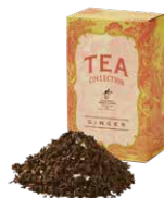
Ginger ジンジャー ¥700 (税込¥770)

バラの花びらとオレンジピールを烏龍茶にブレンド。バラの香りと爽やかなオレンジの風味がこころと身体をリラックスさせてくれます。