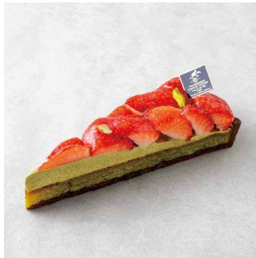
Tarte aux fraises et pistaches タルトフローズピスターシュ