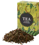
Citron supreme シトロンシュプリーム

セイロンティーに清涼感あふれる ベルガモット柑橘系の香りを付けました。 自然で落ち着きのある芳香をお楽しみください。