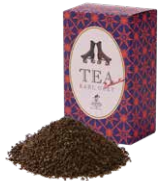
Earl grey (B-O-P) アールグレイ