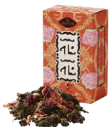
Hoa-hoa 花花 (ホアホア) ¥700 (税込¥770)

バラの花びらとオレンジピールを烏龍茶にブレンド。バラの香りと爽やかなオレンジの風味がこころと身体をリラックスさせてくれます。