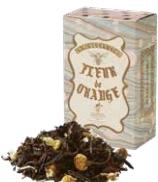
Fleur de orange フルールド オランジェ

セイロンブレンドにダーズリン 1st を。 イランイランとマンダリンが香る まるで花束のようなフレーバーティー。