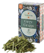
Gray grass グレイグラス ¥700 (税込¥770)

ルイボスベースのアールグレイ。ほのかな甘さとベルガモットのフレッシュさがマッチした一杯。食事に合わせても◎