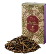
La forêt de gauguin ゴーギャンの森 ¥700 (税込¥770)

スパイスの女王カルダモンをベースにしたエキゾチックなブレンドティーです。ミルクと合わせてお召し上がりください。