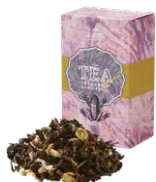
Chamomile darjeeling カモミールダーズリン ¥700 (税込¥770)

「ブルガリアンローズ」から抽出したふんわり甘い薫りと、優しくて華やかな風味がエレガントなティータイムを演出します。