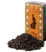
Olga parade オルガパレード