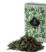
Earl grey japonais アールグレイジャポネ

グレイ伯爵へ敬意を込めた、トラディショナルな アールグレイ。キムンにベルガモットを着香した フレッシュでありながらボディ感のある味わい。