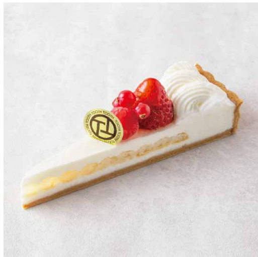
Fromage aux fraises フレーズ・フロマージュ