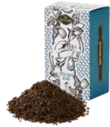
TOOTH TOOTH blend TOOTH TOOTH ブレンド

茶葉の持つ特性を飲み比べてください。どんなお菓子にも良く合うスタンダードなお茶です。