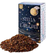
Stella by earl gray ステラバイアールグレイ ¥700 (税込¥770)

ルイボスベースのアールグレイ。ほのかな甘さとベルガモットのフレッシュさがマッチした一杯。食事に合わせても◎