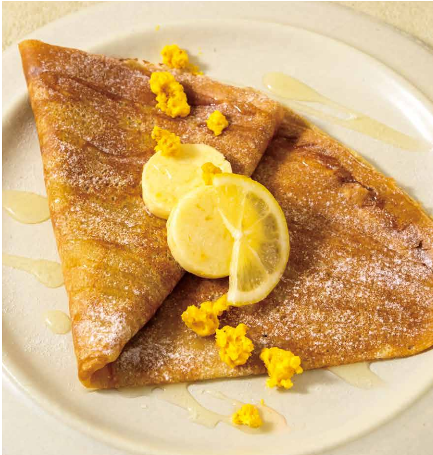
Crêpe au beurre et miel de Rokko, accompagnée de beurre citronné