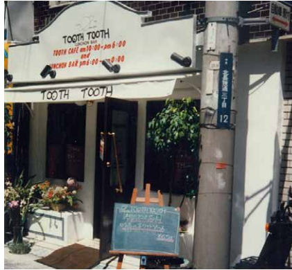
1986年、神戸・トアウエストに開業 『レストランバー TOOTH TOOTH』