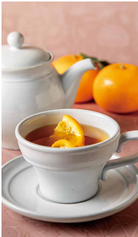
Thé au miel à l'orange parfumé rôti

カカオバニージュをミルクでじっくり煮出したロイヤルミルクティー ホワイトチョコレートのシャンティを重ね ショコラの香りとコクのある味わいが広がります