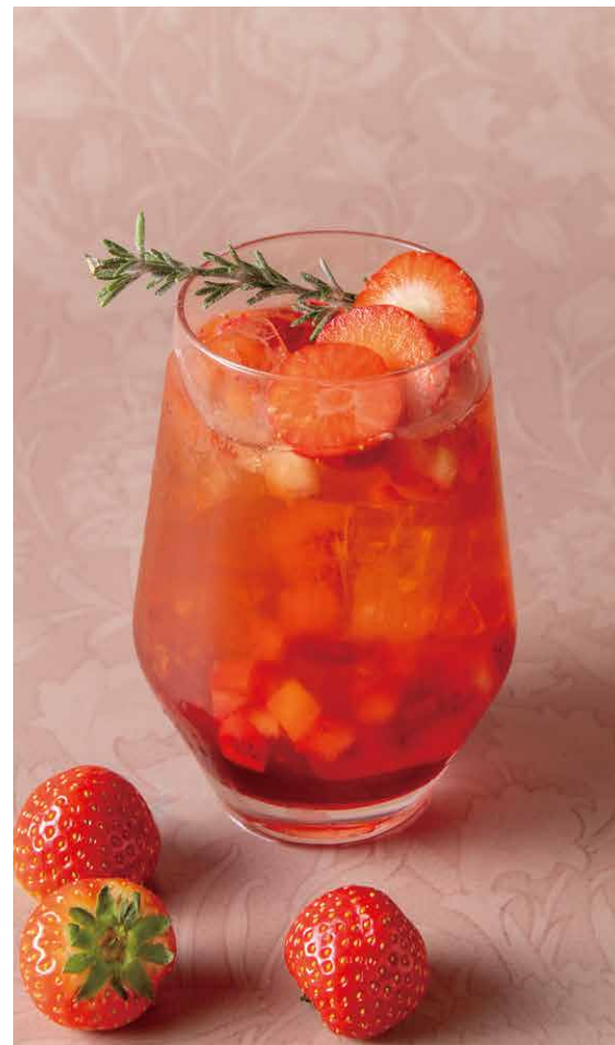
Thé à la fraise et au romarin

カカオとカルダモン薫るゴーギャンの森にフレッシュなオレンジ、 ハチミツを合わせた温かいフルーツティー