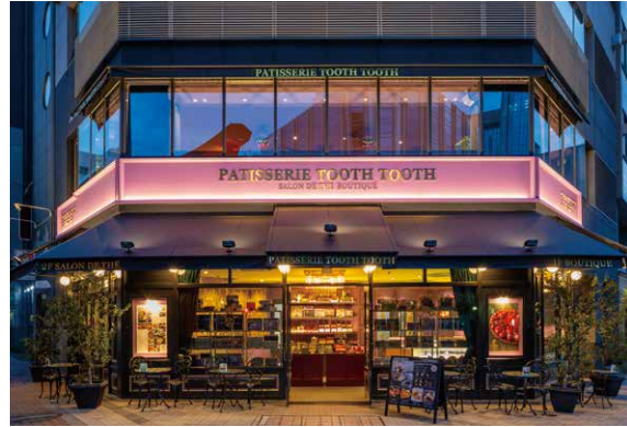
神戸の洋菓子屋「PATISSERIE TOOTH TOOTH 本店」

1986年、神戸・トアウエストの路地裏の片隅で開業した「TOOTH TOOTH」。