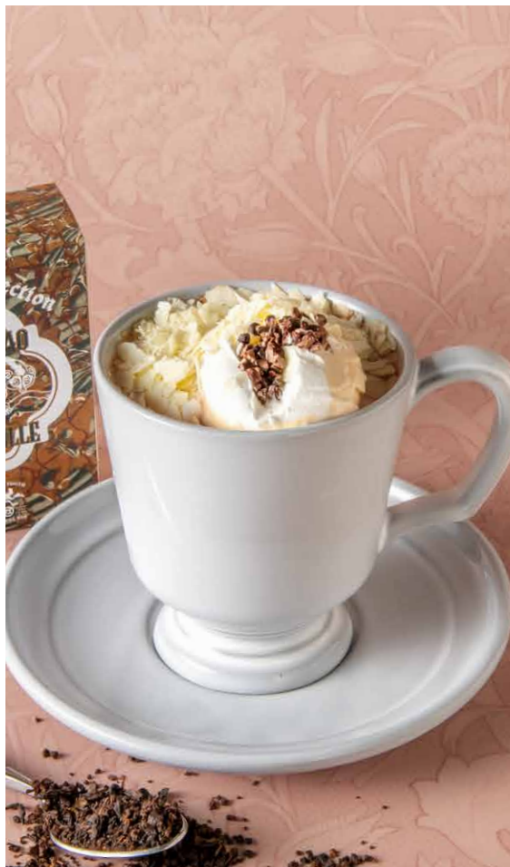
Cacao vanille royal