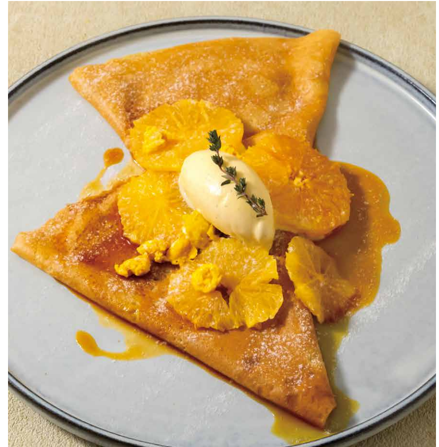
Crêpe caramel à l'orange et au fromage frais

※ガレットはそば粉を使用しております。当店では、ガレットとクレープを同じ鉄板で焼いています。商品のご注文は、お客様のご判断にてお願いしておりますので、ご了承のほど宜しくお願いいたします。