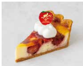
Chaperon シャペロン 917 [834]