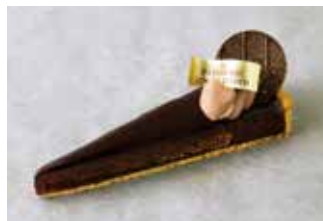
Tarte Berry Chocolate タルトベリーショコラ