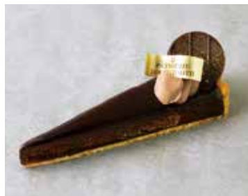
Tarte Berry Chocolate タルトベリーショコラ 836 [760]