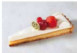
Tarte aux Fromage タルトフロマージュ