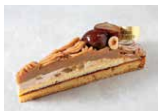
Tarte du Mont Blanc タルトモンブラン