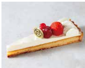
Tarte aux Fromage タルトフロマージュ 836 [760]