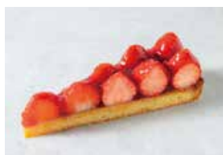
Tarte aux Fraises タルトフレーズ