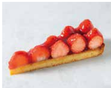
Tarte aux Fraises タルトフレーズ 937 [852]

※お一人様ワンドリンクのご注文をお願いしております Please order one drink per person.