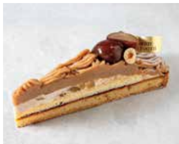
Tarte du Mont Blanc タルトモンブラン 937 [852]