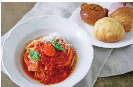
淡路島産トマトのポモドーロパスタ