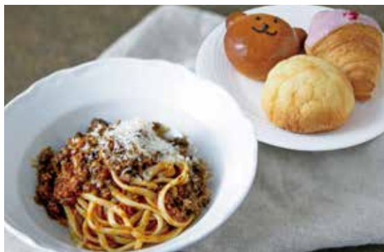
淡路産牛肉のミートソースパスタ