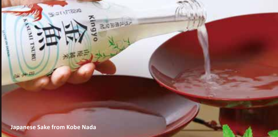
Japanese Sake from Kobe Nada