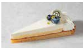
Tarte au Fromage タルトフロマージュ

なめらかなフロマージュクリームを 香ばしいタルトに重ね、 ブルーベリーを添えました。