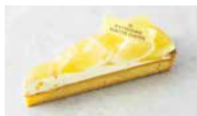
Tarte aux Agrumes タルトアグリューム

なめらかなフロマージュクリームを 香ばしいタルトに重ね、 ブルーベリーを添えました。