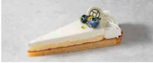
Tarte au Fromage

※お一人様ワンドリンクのご注文をお願いしております Please order one drink per person.