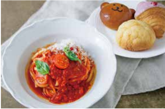
淡路島産トマトのポモドーロパスタ