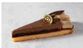
Tarte Earl Grey Chocolat タルトアールグレイ ショコラ