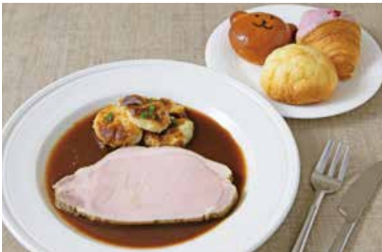
三元豚のローストポーク