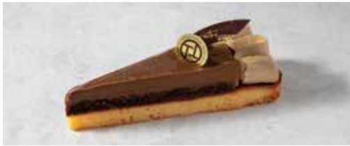
Tarte Earl Grey Chocolat