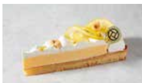
Tarte au Citron タルトシトロン

クリームチーズのアパレイユといちごを ブリゼ生地で焼き上げた 定番のバイクドチーズケーキ