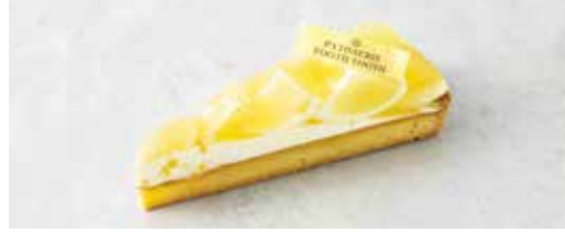
Tarte aux Agrumes