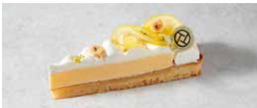
Tarte au Citron