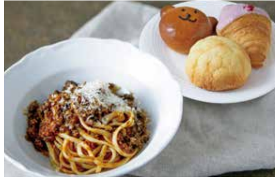
淡路産牛肉のミートソースパスタ