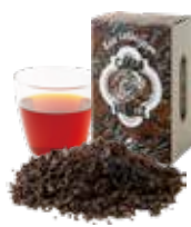
Cacao Vanille カカオバニユ 〔ストレート / ミルク〕 800 [880]

インドとスリランカの厳選茶葉に カカオとバニラの香りをブレンド ミルクを入れて甘いティータイムを