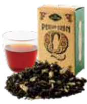
Persian Queen ペルシアンクイーン 〔ストレート / ミルク〕 800 [880]

“スパイスの女王” カルダモンを ベースにしたブレンドティー ミルクと合わせるのがおすすめ