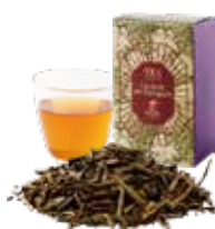
La Forêt de Gauguin ゴーギャンの森 〔ストレート / ミルク〕 800 [880]

甘く芳しいカカオ香を引き出した茶葉に カルダモンを合わせた 後味すっきりほうじ茶ブレンド