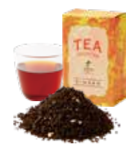
Ginger ジンジャー 〔ストレート / ミルク〕 800 [880]

粗挽きドライジンジャーをブレンド ミルクをたっぷり入れて コクのあるまろやかなジンジャーティーを