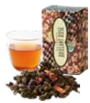
Brilliant Rose ブリアンローズ 〔ストレート〕 800 [880]

穏やかな時間に優しく寄り添うセクション 食後や夜のひとときに、心とからだにそっとなじみます