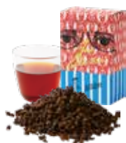
Assam アッサム 〔ストレート / ミルク〕 800 [880]

コク深く、ミルクティーにぴったりなセクション 濃厚な甘さのスイーツやデザートに合う奥行きのある味わい