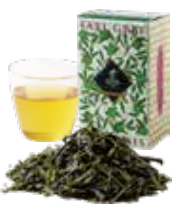
Earl Grey Japonais アールグレイジャポネ 〔ストレート〕 800 [880]

緑茶ベースのアールグレイ フルーティーな香りの後に 緑茶ならではのすっきりとした味わいが広がります